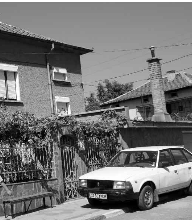
Architektonický ráz a estetika domů v Karakačanské machale (foto: G. Fatková)

práce a odpovědnosti. Například v době nepřítomnosti mladých rodičů doma se o potomky starají automaticky prarodiče. Ve zkoumaném terénu jsem se setkala i s případy mnohaletých pobytů rodičů v Řecku, kdy své děti vidali pouze o prázdninách, po zbytek roku děti vyrůstaly s prarodiči ve společném domě v Bulharsku. Zejména v 90. letech, kdy práce v Řecku byla na jednu stranu nejlukrativnější a na druhou stranu nutností, neboť v Bulharsku byla mezi Karakačany alarmující míra nezaměstnanosti 42 , přebírali prarodiče plnou péči o svá vnoučata už od šesti měsíců věku.