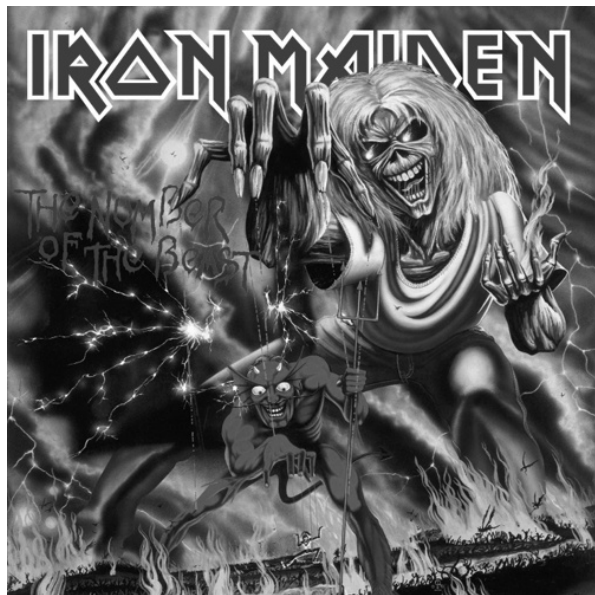
Obr. 1. Obal alba The Number of the Beast skupiny Iron Maiden z roku 1982.

Popisovaný horor/fantasy diskurz metalu, který byl však z dnešního pohledu poměrně odlehčený, lze ilustrovat například na skupině Iron Maiden. Ti si za svého maskota, objevujícího se na obalech alb a různých propagačních předmětech skupiny, zvolili postavu Eddieho, který horor/fantasy diskurz dobře vystihuje. Jak můžeme vidět na obrázku 1 (obal alba od Iron Maiden The Number of the Beast z roku 1982), postava Eddieho tvoří jakýsi kyborgizovaný obraz smrtky, zombie a dalších postav (viz Walser, 1993: 153).