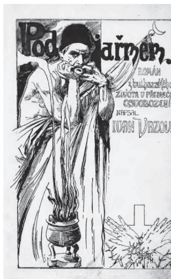
Titulní obálka prvního českého vydání Vazovova románu Pod jařmem

V sémiotickém vyznění vypovídá nejen četnost jednotlivých edicí, ale také jejich grafické zpracování a ilustrace. Vizuální působení výtvarného pojetí vychází zpravidla vstříc dobovým konvencím a s nimi spjatým změnám v estetických nárocích, a proto obrazový doprovod jednotlivých vydání Vazovova neznámějšího románu může výstižně ukázat proměny v jeho recepci. 18