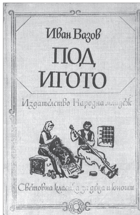
Stylizované motivy ze života porobeného bulharského národa na jednom vydání Vazovova Pod jařmem ze 60. let

V době sociálních sítí se tyto projevy lidové tvorivosti mohou přirozeně šířit rychleji, současně se však za těchto okolností stírají ve veřejném (vir-