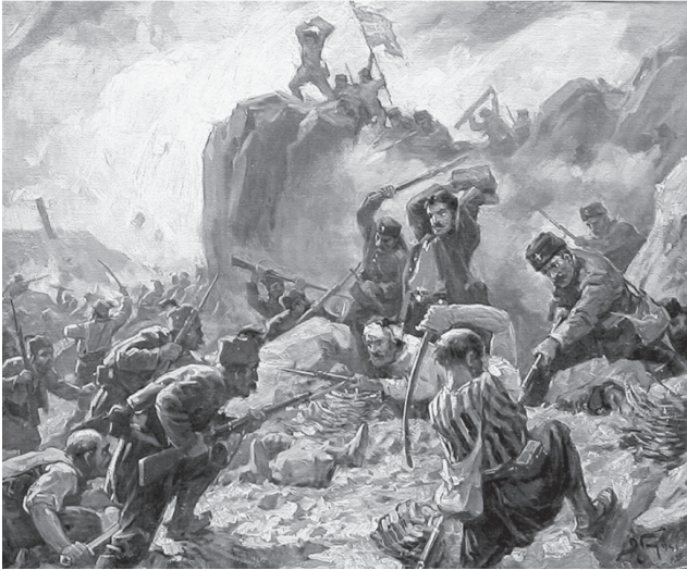
Dimitar Gjuzdenov (1891–1979): Boj o Šipku . Historické plátno s motivem bojů o důležitý průsmyk, jenž se stal symbolem rusko-turecké války z let 1877–1878, vystupuje v současném společenském kontextu jako příklad soužití Bulharů s osmanskými Turky poněkud nepatřičně.

dá množství příznakových situací, jejichž podstata vyplývá z navracujících se obrazů minulosti kupříkladu v souvislosti s rozšiřující se Evropskou unií a požadavkem bezproblémových sousedských vztahů mezi jednotlivými členskými státy. Aktualizace těchto souvislostí se dotýká i oblasti školních osnov, jak to plasticky ilustrují bouřlivé diskuze o podobě učebnic bulharského dějepisu a občanské nauky, k nimž došlo v roce 2016. Nabízí se tak možnost se nad otázkou osmanského odkazu, jeho recepce a terminologických rozpětí zejména v bulharském kontextu hlouběji zamyslet.