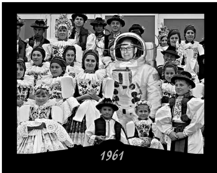
Známa momentka, na níž se Garfinkel druží s domorodci v místní hospodě. Fotografie byla publikována se svolením jejího autora, majitele Slováckého dvora.

Edmund Husserl by si nikdy nebyl sto představit, jakého pokroku dosáhne jeho koncept přirozeného světa díky Garfinkelově usilovné práci v Ostrožské Nové Vsi. Alfred Schutz sice už dříve Husserlův filosofický koncept obrátil sociologicky z hlavy na nohy, ale Garfinkelovy inovace znamenaly obrovský průlom v možnostech empirického etnografického nakládání s přirozeným světem lidské každodennosti a s vykazováním etnometodologických analýz.