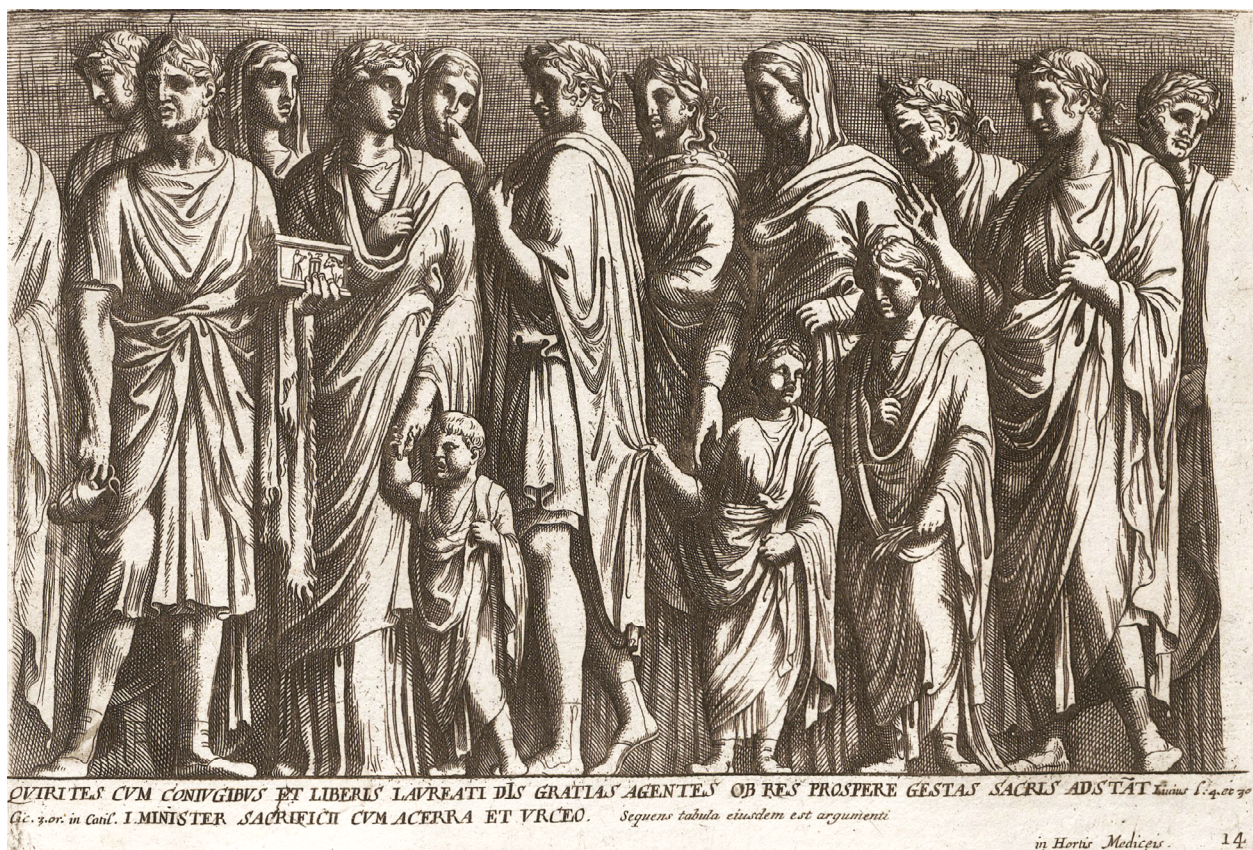
12 – Pietro Santi Bartoli – Giovanni Pietro Bellori, reliéf z Ara Pacis ve Ville Medici , 1666. Admiranda Romanarum antiquitatum , Romae [1666], fol. 41

K tomuto tématu se nedávno vyjádřila ve svém článku Radka Nokkala Miltová, která sledovala linii antický originál – grafická předloha – kroměřížská realizace na příkladu sochy označené jako „SENECA MORIENS“. 52 Nemeně explicitní je tento „interpretační posun“ také u dalších kompozic, například u sochy nazývané La Zingarella , 53 která sloužila jako předloha pro kroměřížskou „MULÆGYPTIA“. Na počátku stálo torzo pozdně klasické drobné sošky Artemis z pentelického mramoru, které je dokumentováno už v polovině 16. století a označeno zřejmě pro podobnost