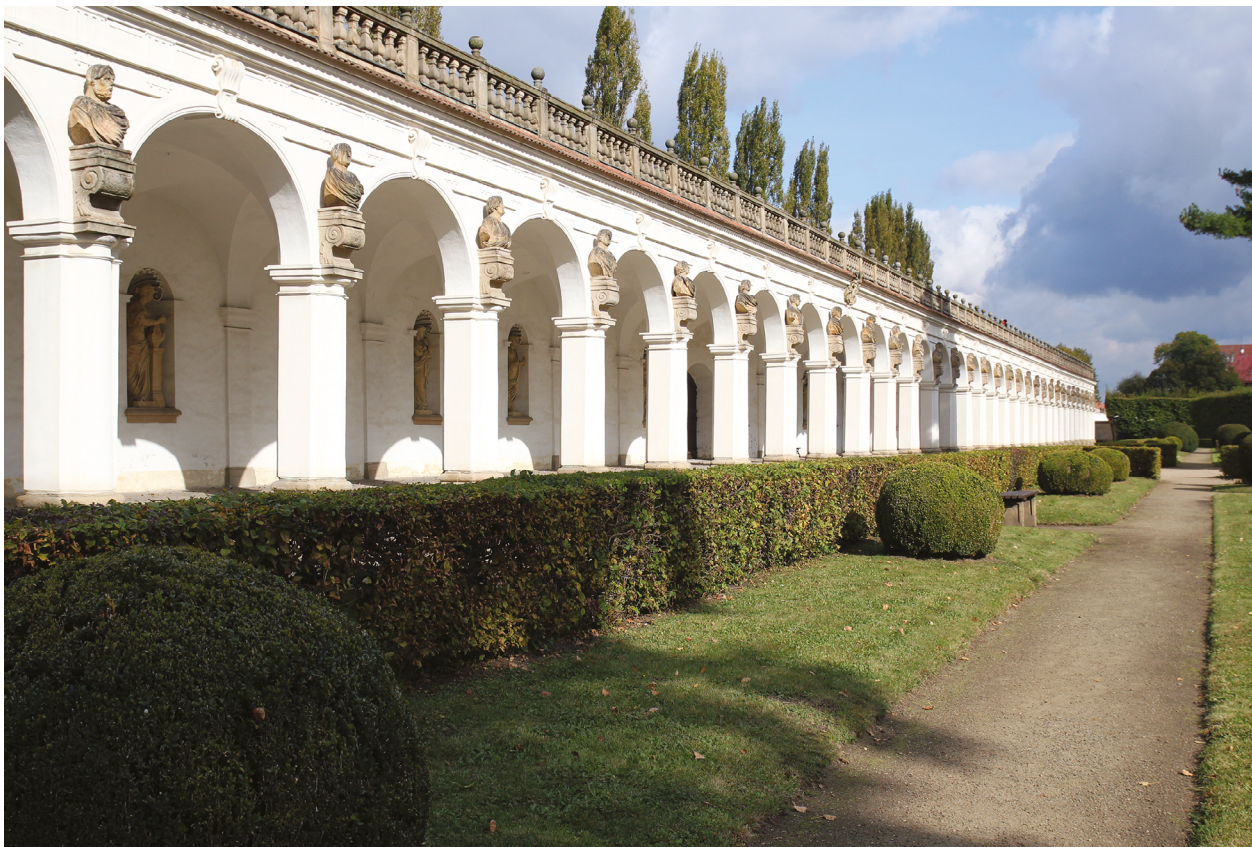
1 – Kroměříž, kolonáda Květné zahrady, okolo 1665–1675

grafických vzorů do řešení sochařské výzdoby arkádové lodžie.