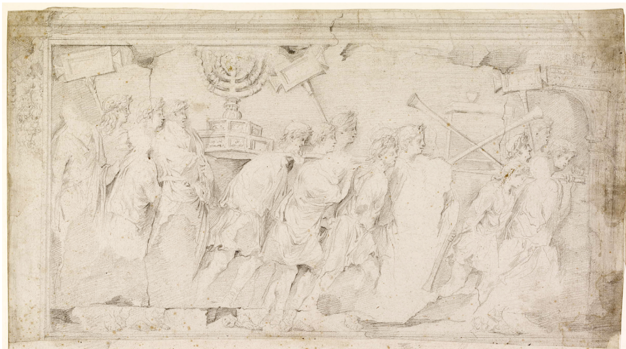
7 – Carlo Maratti (?), reliéf s triumfálním průvodem z Titova oblouku, po 1645. Londýn, British Museum

Na rozdíl od obou předchozích případů však zde nejsou rozdíly mezi oběma verzemi grafik tak zjevné. Oporou může být detail obětní scény na přední stěně skříňky na kadidlo, kterou drží muž v pokrčené ruce. Ten je na kroměřížské soše proveden velmi schematicky, ale z motivu je patrné, že sochař z vyobrazeného námětu správně „přečetl“ jeho podstatné části, tzn. trojnožku, z níž stoupá dým, a po jejích stranách postavy obětníka a zvířete, z něhož zbyla na kroměřížské soše jen hlava. [obr. 13] Uvedený motiv je více do detailu propracován na Bartolho grafice. Naopak je prakticky vyloučeno, aby stejným způsobem mohl sochař