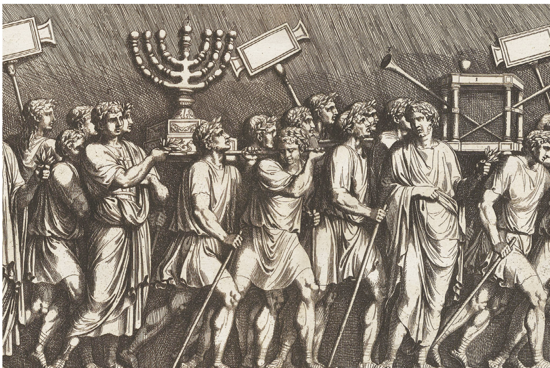
9 – Pietro Santi Bartoli – Giovanni Pietro Bellori, reliéf s triumfálním průvodem z Titova oblouku, 1666. Admiranda Romanarum antiquitatum, Romae [1666], fol. 7