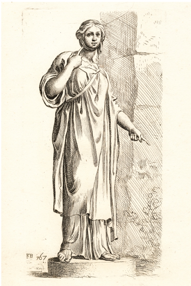
15 – François Perrier, La Zingarella (Mulier Aegyptia) , 1638. Segmenta nobilium signorum et statuarum , Romae 1638, fol. 67