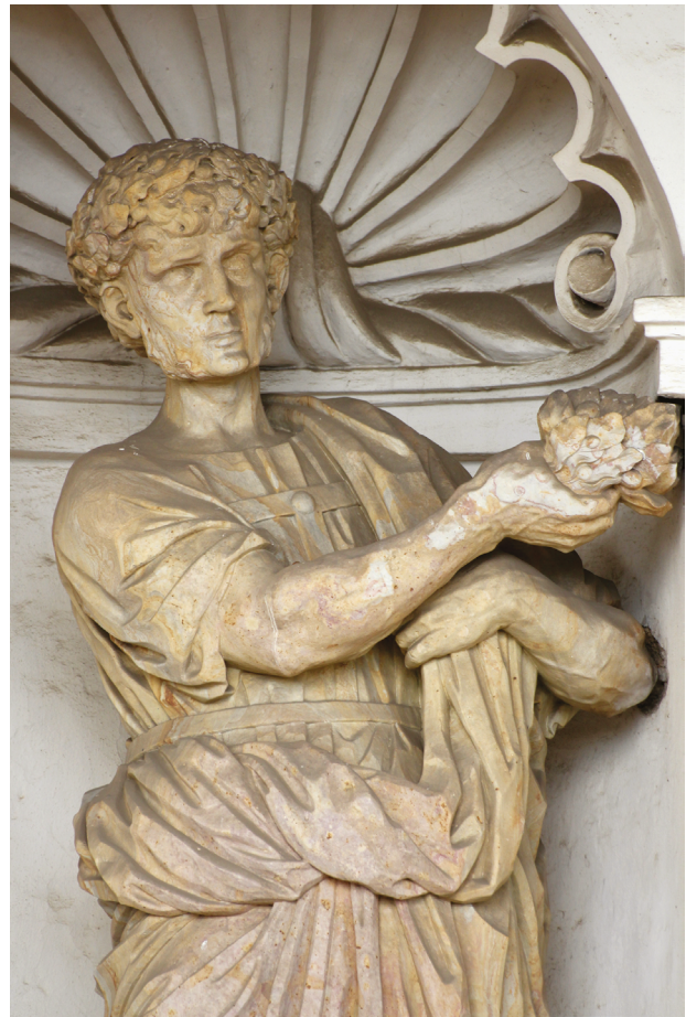
11 – Eques Romanus Triumphans – detail tuniky s falérami, první polovina 70. let 17. století. Kroměříž, kolonáda Květné zahrady

interpretovat zběžně provedené tahy na grafickém listu Perrierově.