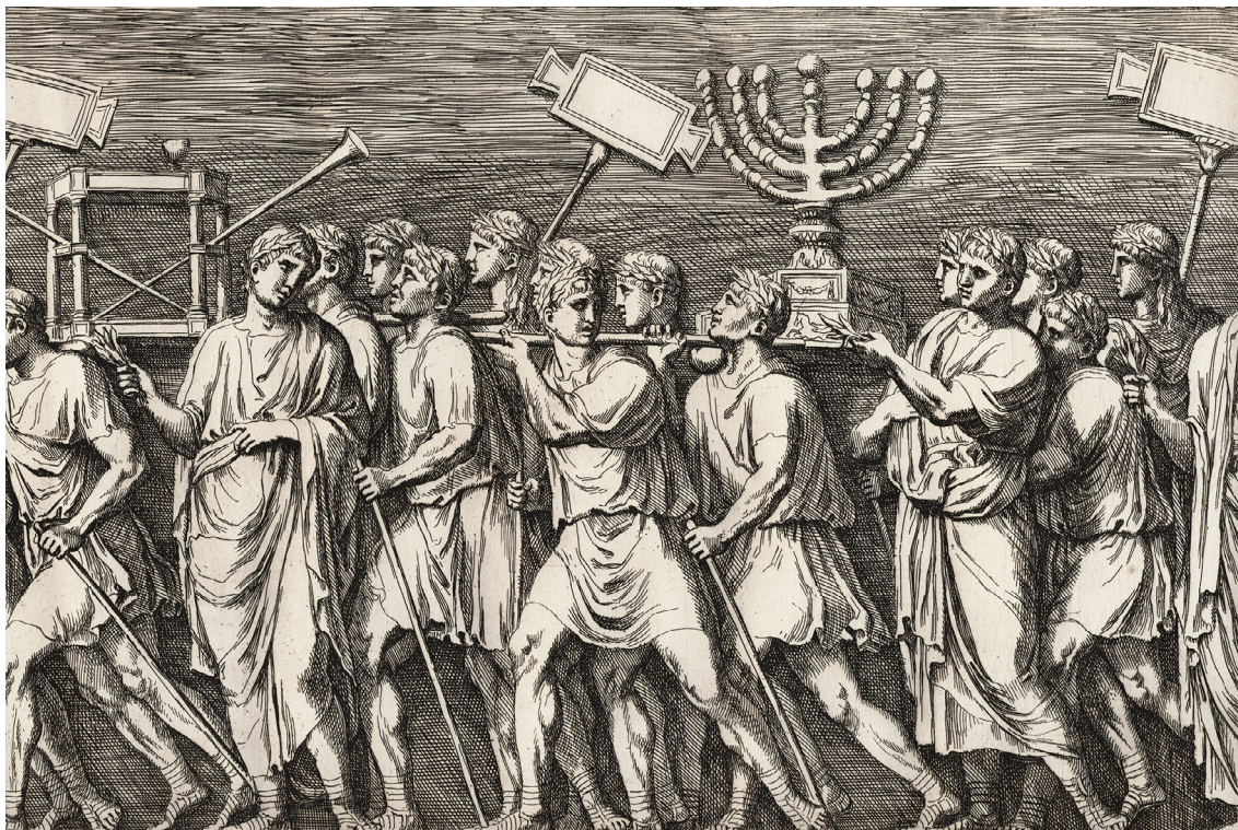
8 – François Perrier, reliéf s triumfálním průvodem z Titova oblouku – detail, 1645. Icones et segmenta illustrium e marmore tabularum, Romae 1645, fol. 1