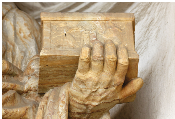
13 – Flamen – detail ruky se skříňkou, první polovina 70. let 17. století. Kroměříž, kolonáda Květné zahrady

Novodobé estetické požadavky významně ovlivnily také podobu torz v sochařské sbírce kardinála Camilla Pamphiljho deponované v Casino del Belrespiro, jejichž zpodobení nacházíme v albu Villa Pamphilia . Kolekce sice nepatřila k nejvýznamnějším, nejkvalitnějším ani největším v Římě, přesto ji proslavilo právě grafické album reprezentující spíše ideální představu o její výjimečnosti. Jednotlivé sochy byly Barrièrem a Faldou zachyceny v silně restaurovaném stavu vycházejícím ze svébytného barokního pojetí antiky a umístěny do imaginárního prostředí zahrady s průhledy do okolní krajiny, a to navzdory tomu, že naprostá většina z nich se nacházela v interiéru. Řada soch je na grafikách doplněna neexistujícími podstavci s identifikujícími nápisy či ještě více než při samotném integrujícím restaurování získala nápadnou podobnost s jinými slavnými antickými sochami, jako byl například Umírající Gal – tzv. Gladiátor Ludovisi, případně Starý rybář označený na grafice pro svou podobnost se slavnějším restaurovaným exemplářem ve sbírce Borghese, a navzdory zjevně odlišnému námětu, jako „Seneca Moriens“. 58