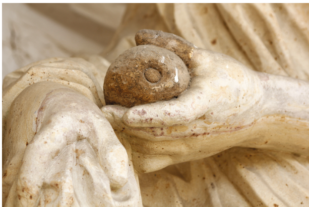
6 – Cassandra – detail ruky držící jablko, první polovina 70. let 17. století. Kroměříž, kolonáda Květné zahrady

Konstantinova oblouku. Do raného novověku se dochovala s poškozeními, kdy chyběly nebo byly otlučeny hlavy všech čtyř mužských postav, části jejich paží či rukou. Obětující kněz na pravé straně scény, který sloužil jako předloha pro kroměřížskou sochu, neměl celistvou hlavu, chybělo mu vnější (levé) předloktí a pravá ruka. François Perrier na svém převedení do grafiky 42 chybějící části dopracoval, a to včetně pravé ruky držící obětní misku. Větší shody v provedení detailů také zde vykazuje Bartolho mladší kopie. 43 Proto např. také detaily vázání bot postavy obětujícího kněze jsou lépe čitelné a mohly tak – na rozdíl od Perrierovy grafiky – spíše sloužit jako zdroj inspirace pro kroměřížského sochaře.