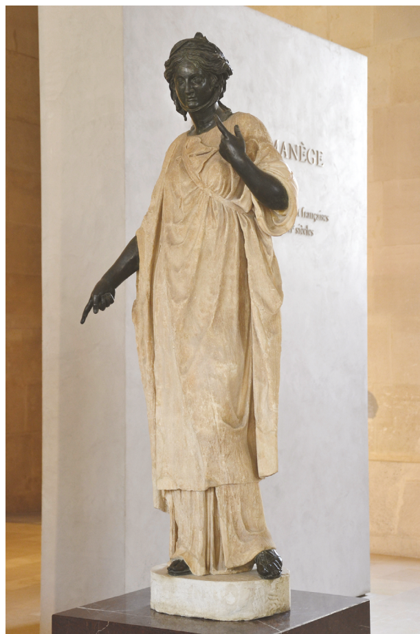
14 – La Zingarella, antické pozdně klasické torzo restaurované na počátku 17. století Nicolassem Cordierem. Paříž, Louvre

Takovéto posuny v ikonografické i stylové interpretaci antických soch byly v 17. století velmi běžné. Vedle soch jako „MULÆGYPTIA“ či „SENECA MORIENS“ lze jako