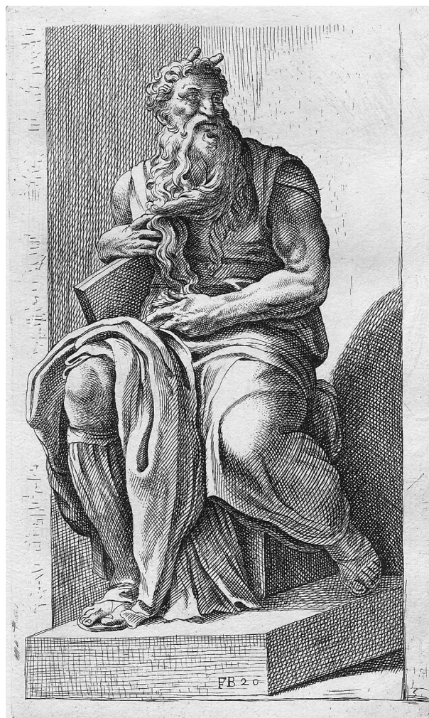
3 – François Perrier, Michelangelův Mojžíš , in: Segmenta nobilium signorum et statuarum , Romae 1638 (vyd. 1653), fol. 20