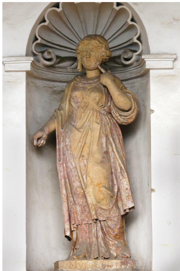
16 – Mulier Aegyptia , první polovina 70. let 17. století. Kroměříž, kolonáda Květné zahrady

další zjevný příklad uvést statui pojmenovanou v Kroměříži „ΑΚΤΑΙΟΝ“. Jejím antickým prototypem byla pozdně římská socha lovce opatřená portrétní hlavou císaře Galliena, paludamentem přes levé rameno a postavou psa u pravé nohy. 59 V albu Villa Pamphilia byla jen minimálně restaurovaná a doplněná antická statue označená jako „Venator“ (Lovec), 60 ovšem v Kroměříži došlo k dalšímu upřesnění a z nespécifikovaného lovce se stal mýtický Aktaión. 61 Celá sochařská kompozice, původně založená na typu Doryforos, však byla v Kroměříži ještě dále transformována, až téměř k nepoznání, přemístěním psa mezi nohy lovce a posunutím roucha, nově přichyceného popruhem, z levého ramene k boku, tak aby zakrývalo ohanbí. 62