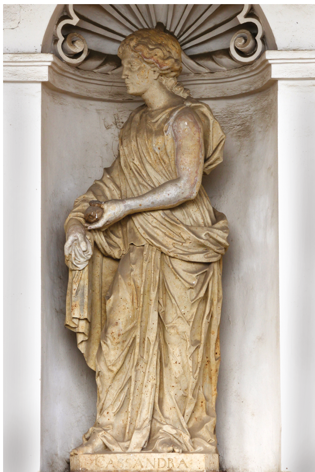
5 – Cassandra, první polovina 70. let 17. století. Kroměříž, kolonáda Květné zahrady

Zatímco architektura Le Colonnacce stála v centru pozornosti umělců již od renesance, figurální výzdoba byla až do poloviny 17. století reprodukována, i vzhledem k vysoce fragmentárnímu stavu dochování, jen vzácně. Výjimkou je cyklus kreseb vytvořených pro album Cassiana Dal Pozzo,36 kde byly obě části reliéfu s vyobrazením Venuše Cloaciny s dalšími božstvy a s personifikací vodního pramene spojeny do jedné kompozice podobným způsobem, jakým to pak učinil Pietro Santi Bartoli. [obr. 4] Na kresbách Dal Pozzo alba i na Bartoliho rytině byly chybějící partie reliéfu navíc „dorestaurovány“: u Venuše Cloaciny (v Kroměříži „MEDVLLINA“) byla doplněna hlava a postava k ní obrácené ženy zahalené v peplu (kroměřížská „CASSANDRA“) získala pravou paži. [obr. 5] Kroměřížský sochař, který špatně inter-