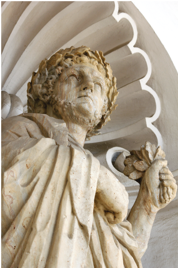
10 – Civis Romanus Triumphans – detail tváře, první polovina 70. let 17. století. Kroměříž, kolonáda Květné zahrady.