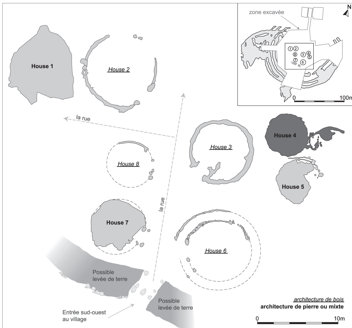
Illustration 2 : Broxmouth : la phase 6 (d'après Büster et Armit 2013, 116, Illustration 7.1).

des roundhouses (voir Giles 2012, chapitre 3 ; Sharples 2010, p. 201-208).