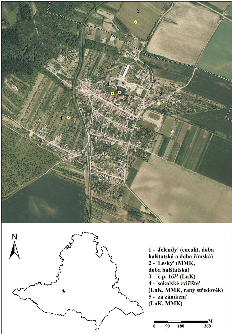
Obr. 1. Bohutice. Poloha zájmové oblasti a lokalizace dřívějšího osídlení (digitalizace H. Koubková).