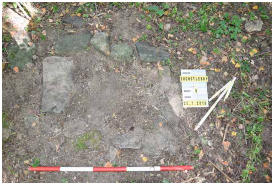
Obr. 7. Suchotlesky (k. ú. Ronov nad Doubravou). Detail dochované zděné konstrukce mlýna (obj. 6). Pohled od jihovýchodu. Stav v roce 2018.

V rámci zpracování geodeticko-topografických dat, LLS a povrchového průzkumu byly definovány tři koncentrace antropogenních reliktů. První koncentrace zaujímající ústřední jádro tvrze a příkop je umístěna na skalním výběžku v nadmořské výšce 251–250 m n. m. (obr. 3). Samotná tvrz byla chráněna na východní straně strmým svahem a vodním tokem, na západní straně vytvořenou vodní nádrží a na severu příkopem a menším valem. Fortifikace mohla být doplněna i o vysunutou věžovitou stavbu čtvercového půdorysu umístěnou u brodu přes řeku Doubravu (obj. 3 – obr. 2:3). Nejhůře dochovaným místem je jižní strana tvrziště, na které dnes