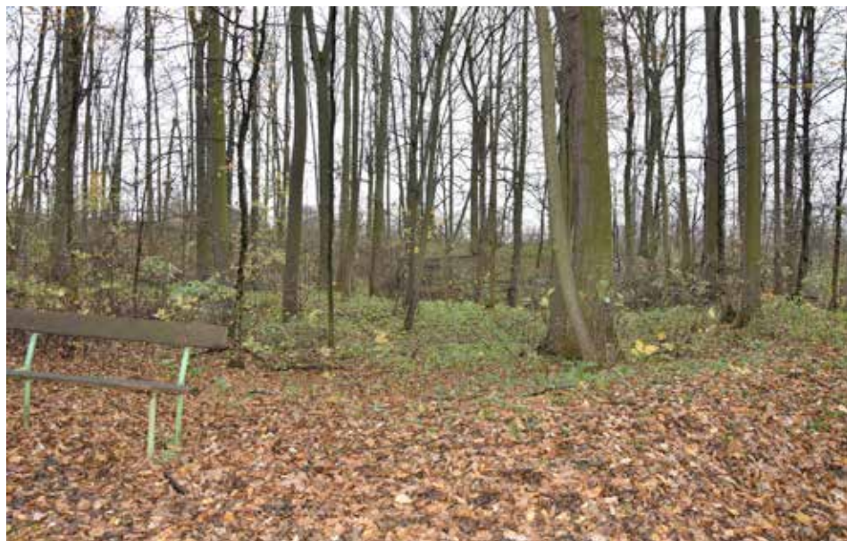
Obr. 5. Suchotlesky (k. ú. Ronov nad Doubravou). Hospodářský dvůr s centrálním zahloubeným objektem (obj. 4). Pohled od jihovýchodu. Stav v roce 2017.