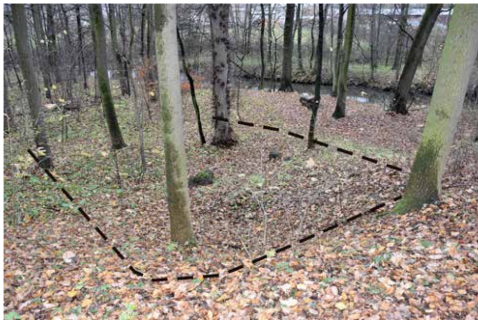
Obr. 6. Suchotlesky (k. ú. Ronov nad Doubravou). Relikty nejmladší zástavby – obj. 5. Pohled od západu. Stav v roce 2017.