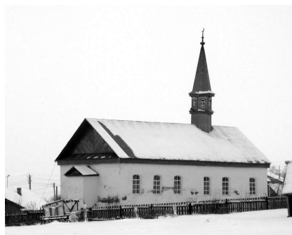
Obr. 2–3. Architektura mešit v Povolží

Mladší generace Tatarů se podobají svým slovanským protějškům také módou a životním stylem. Nemálo z nich zdobí tetování (což zapovídá Korán i Bible) a nevyhýbají se ani alkoholu, byť tatarská mládež je v tomto ohledu podstatně rezervovanější než ta ruská (ačkoli i u ní se dnes jeví být alkoholismus na ústupu ve srovnání s generacemi narozenými za sovětské éry). K islámu se však Tataři všech