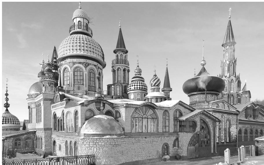
Obr. 4. Chrám všech náboženství na okraji Kazaně