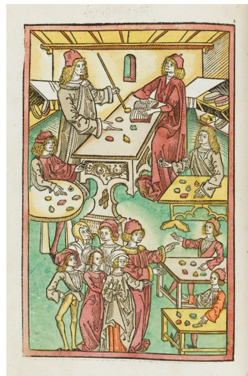
Obr. 105: Detail z iluminace Hortus sanitatis, sign. EPB.e., Jacob Meydenbach, 1491, Wellcome Library London