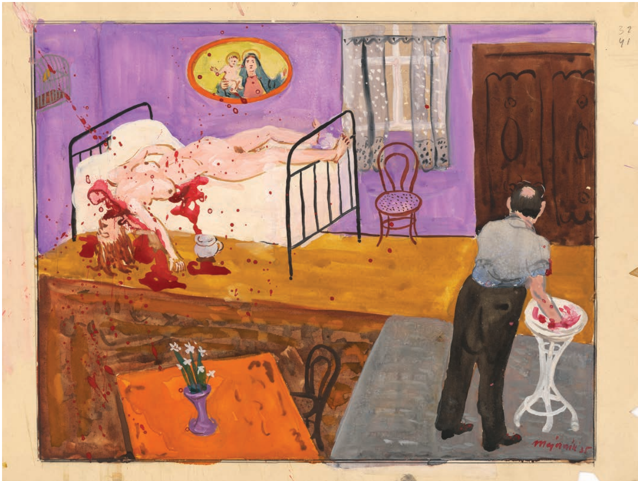
4 – Cyprián Majerník, Milenci na periférii , 1935. Bratislava, Slovenská národná galéria