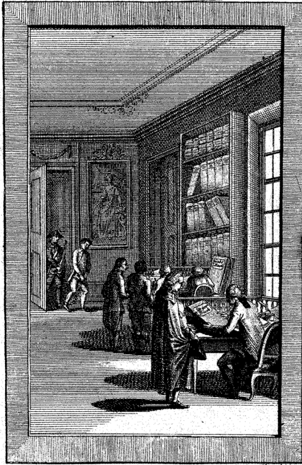
Abb. 1. Dominien. Kupferstich in Oktavformat. Joseph II. – Gesetze, Bd. 8 (1787), Titelblatt, nicht paginiert. 1

Das Titelblatt des achten Bandes der Josephinischen Gesetzsammlung versinnbildlicht grob Sinn und Zweck von Patenten und Verordnungen und damit auch die Quelle des „Gemeinwohls“ – nämlich die Arbeit von Untertanen. Die Abbildung zeigt eine Herrschaftskanzlei, deren halb geöffnete Tür die ganze Reihe von Untertanen ahnen lässt, die ergeben ihre Gelder mitbringen und ihre Pflichten bestätigen lassen: zwei Schreiber führen die wichtigsten Bücher des Dominiums: nämlich das Steuerbuch und das „Gabebuch“, also das Buch der Untertanen-Pflichten und -Abgaben. Beide Bücher sind symbolisch dargestellt, da sie in so einer Form nie bestanden hatten, der Zweck ist hier