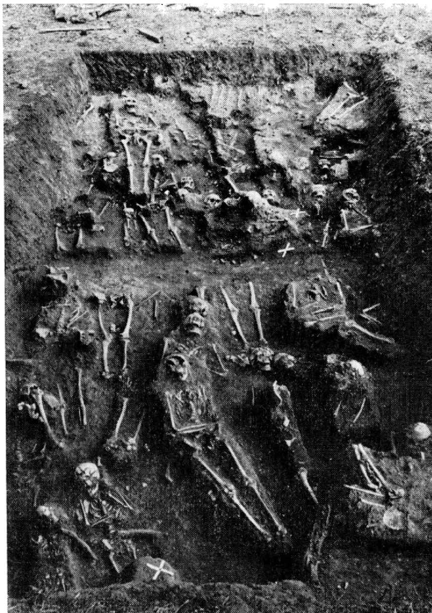
Obr. 5. Sázava, okr. Kutná Hora. Pohřebiště kolem tetrakonchy v severní zahradě bývalého slovanského kláštera.

tento opat přestavěl a podstatně rozšířil původní Prokopův kostel, kde byl Prokop roku 1053 pochován. Svěcení přestavěného kostela se odbývalo v roce 1095, rok před konečným vyhnáním slovanského osazenstva ze Sázavy (1096).