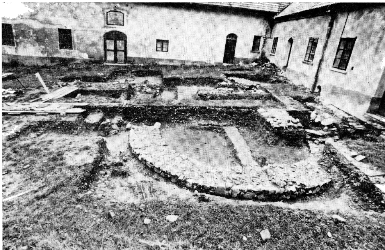
Obr. 2. Sázava, okr. Kutná Hora. Východní apsida románského kostela z 11. století na prvním nádvoří bývalého kláštera.