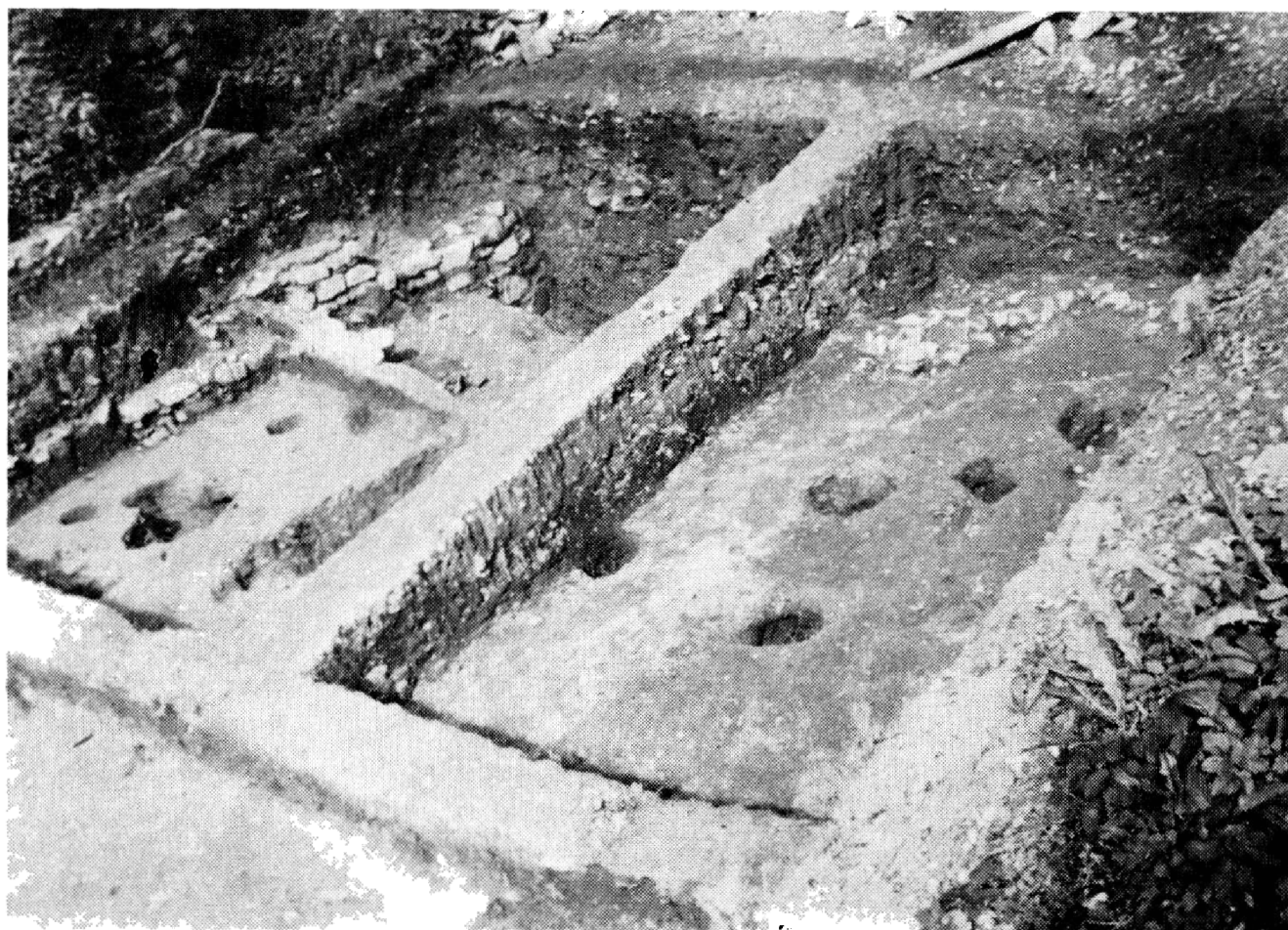
Obr. 3. Sázava, okr. Kutná Hora. Sídlištní objekty v severní klášterní zahradě.