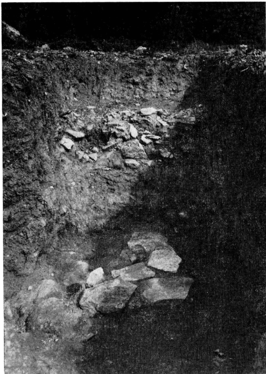
Obr. 4. Sázava, okr. Kutná Hora. Výzkum sídliště v severní zahradě, severní profil.

před nedostavěným gotickým kostelem. Téměř v ose nedostavěné severní gotické lodi byly nalezeny základy půlkruhové apsidy (š. 110 cm), plentované dvěma řadami lomového kamene; vnitřní jádro zdiva bylo sypané z drobnějšího lomového kamene, promíšeného maltou. Vnitřní rozpětí apsidy bylo 6 m. Jižní boční zdivo se objevilo v negativním základu, vysypaném maltou; při severní straně bylo porušeno základy barokní konírny a zachovalo se jen torzovitě. Tři sondy, založené směrem jižním, zachytily kostrové pohřebiště, provázené u jedné kostry esovitou bronzovou záušnicí a dvěma mincemi, z nichž jedna patří stříbrnému brakteátu.