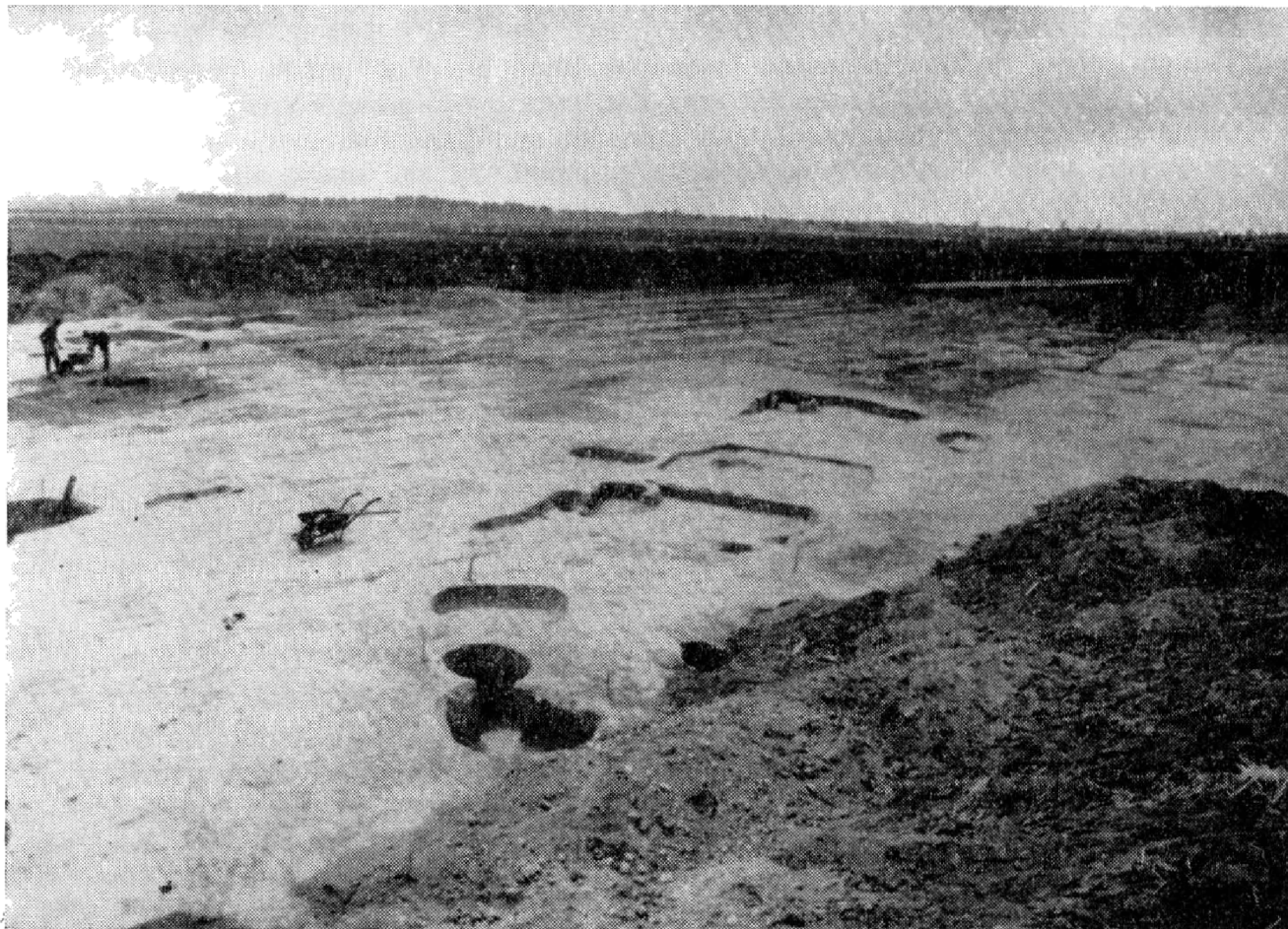
Obr. 1. Slovenská Nová Ves-Zelenež, pohľad na odkryté príbytky.