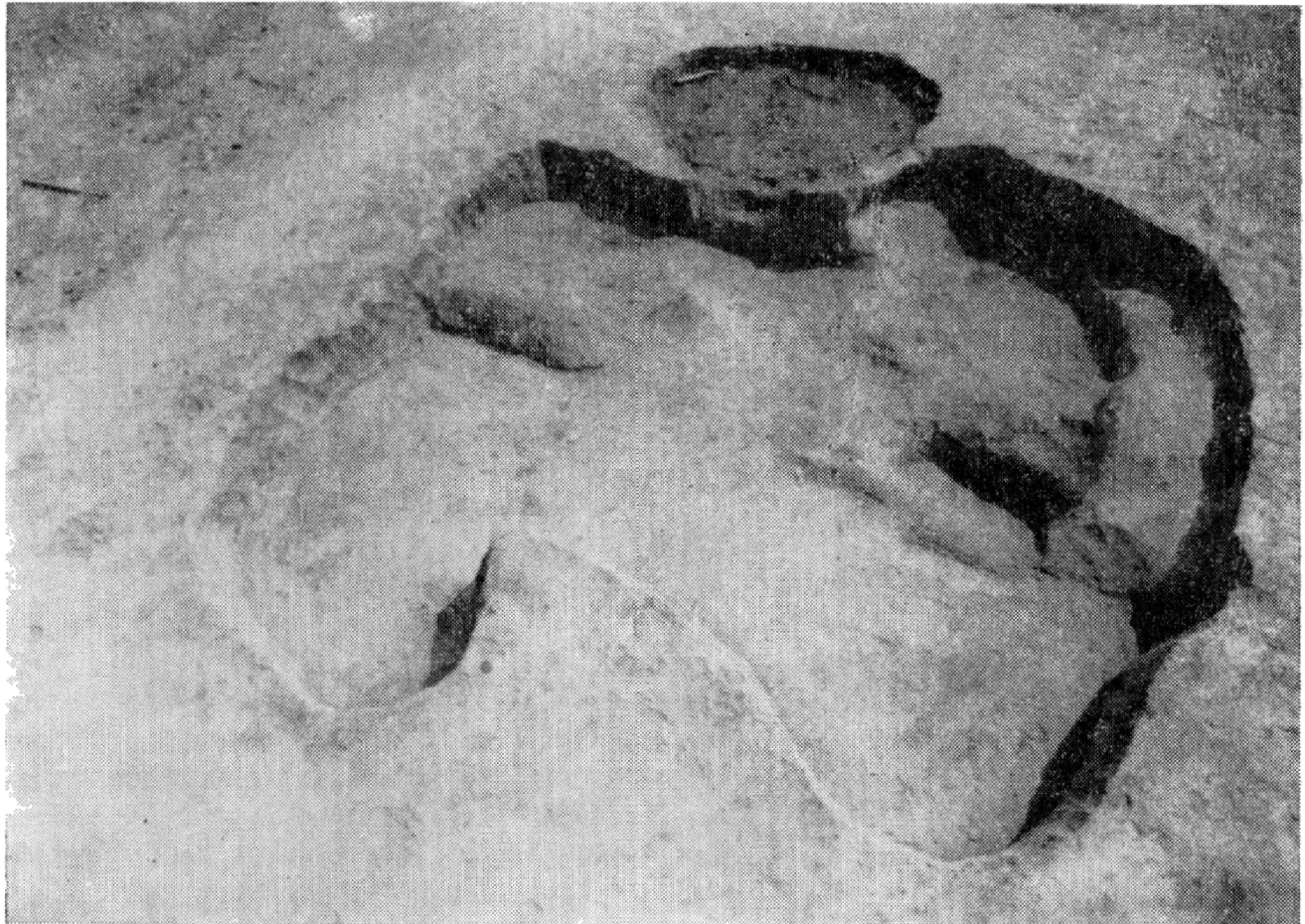
Obr. 4. Slovenská Nová Ves-Zeleneč, mohutná klenbová pec s veľkou predpecovou jamou (obj. 2/76).