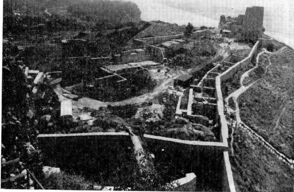
Obr. 2. Stredný hrad.