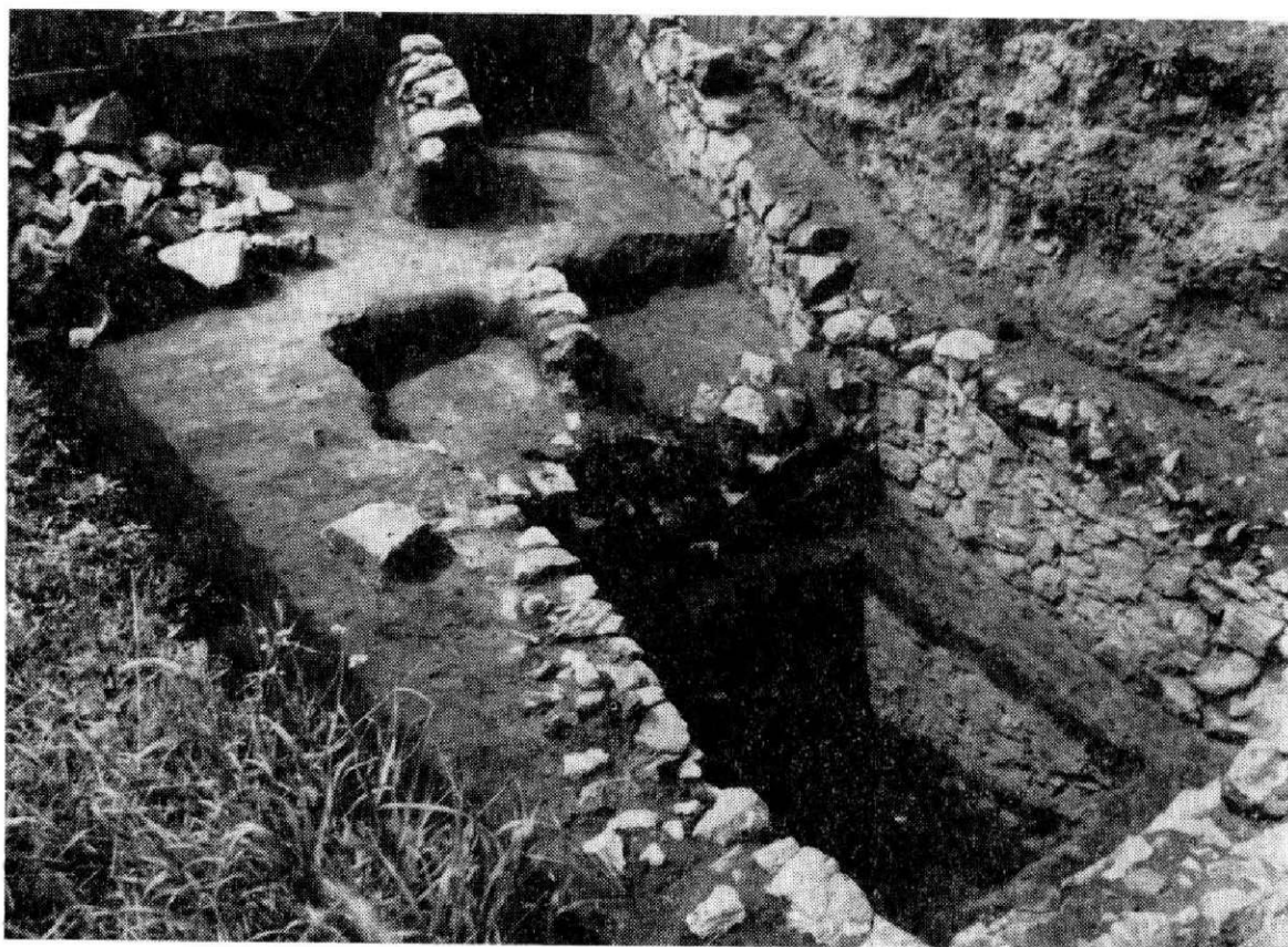
Obr. 3. Spodná časť architektúry vo východnej časti hradu.