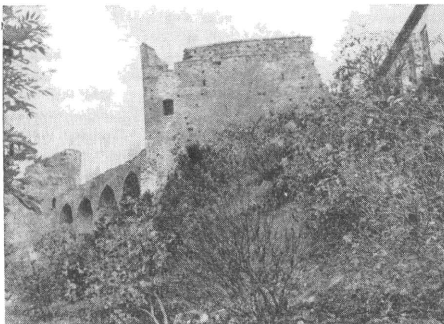
Obr. 4. Velhartice. Pohled na horní hrad (věž, most a gotický palác) od JZ.