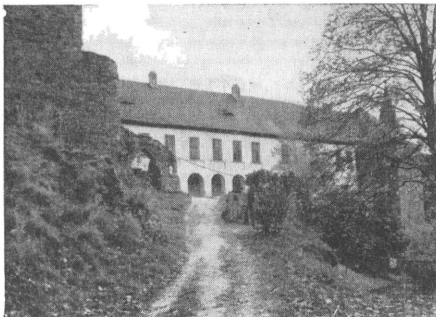
Obr. 3. Velhartice – Huertovo křídlo od SZ. Vlevo starý palác a zbytek gotické brány horního hradu.