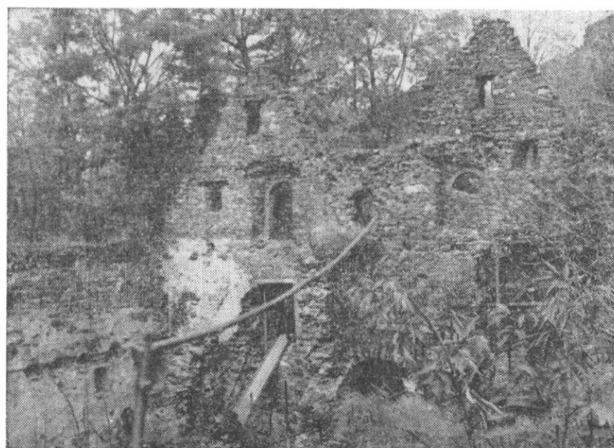
Obr. 5. Velhartice. Hradní pivovar od J.