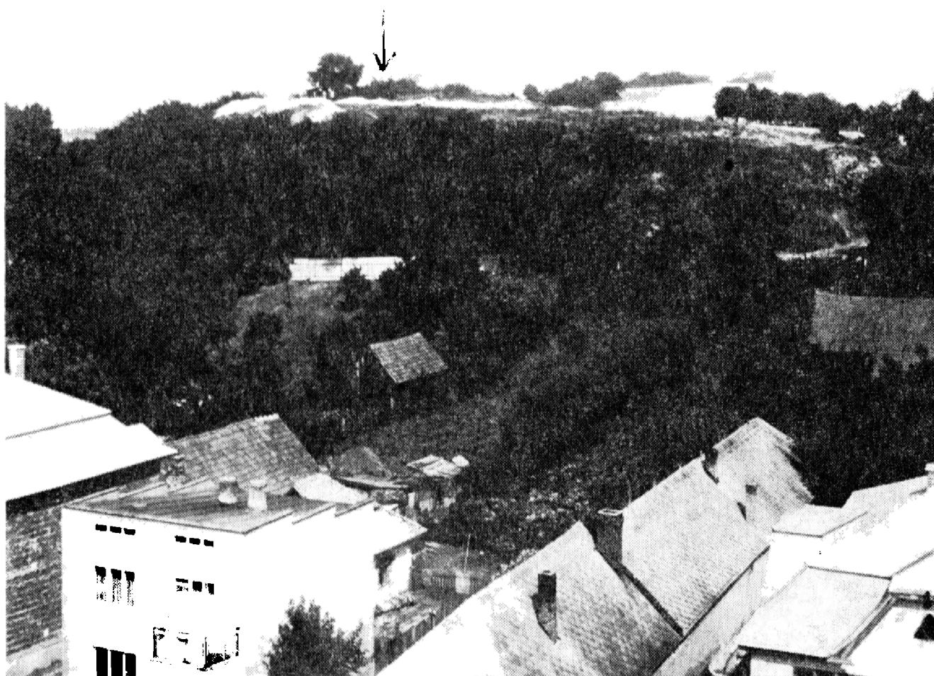
Obr. 1. Košice-Krásna: Pohľad na lokalitu z juhu.

Košicko-krasnianska rotunda (v ďalšom krasnianska) zistená na historicko-archeologickom výskume zaniknutého stredovekého benediktínskeho kláštora na lokalite Breh (obr. 1) v katastri Košice-Krásna nad Hornádom bola situovaná do severovýchodného nárožia celého kláštorného stavebného komplexu. Objavili sme ju vo výskumnej sezóne 1976 ako architektonický útvar, ktorý uzatvára vlastný kláštorný komplex. Objavené zvyšky centrálnej stavby – rotundy – nachádzali sa takmer v geometrickom strede bádanej polohy. V tom čase krasnianska rotunda patrila k najvýchodnejšie vysunutým sakrálnym stavbám tohto typu u nás. Východnejšie poznáme iba rotundu v Horjanoch na Zakarpatskej Ukrajine. Zvyšky rotundy v Michalovciach sa odkryli až o rok neskoršie, r. 1977. Určité indície boli tu zistené už r. 1951. V uvedenom roku totižto robotníci pri kopaní odpadového kanála medzi r. k. kostolom a kaštieľom narazili na stopy „najstaršej archi-