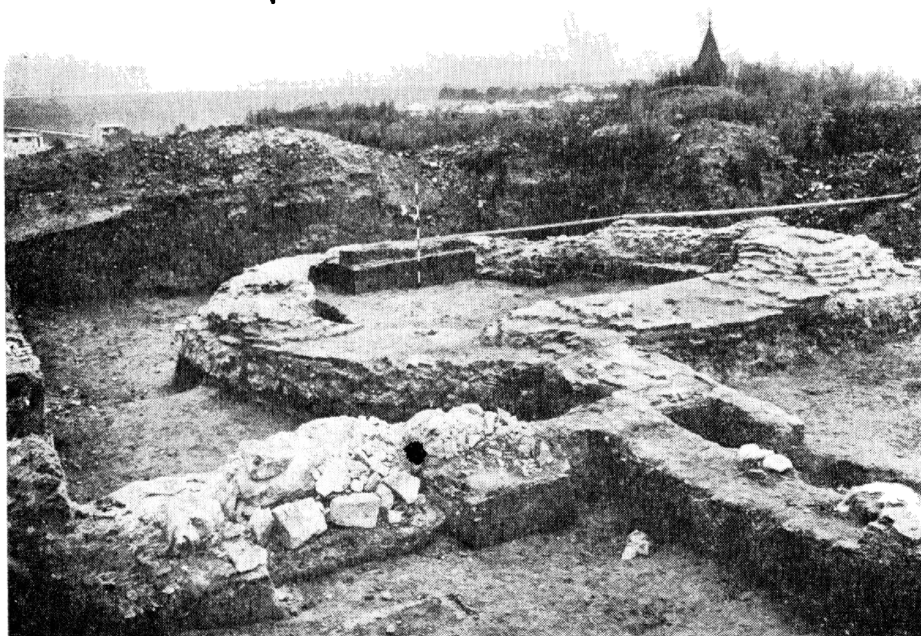
Obr. 5. Košice-Krásna: Pohľad na odkrýtu rotundu zo západu.