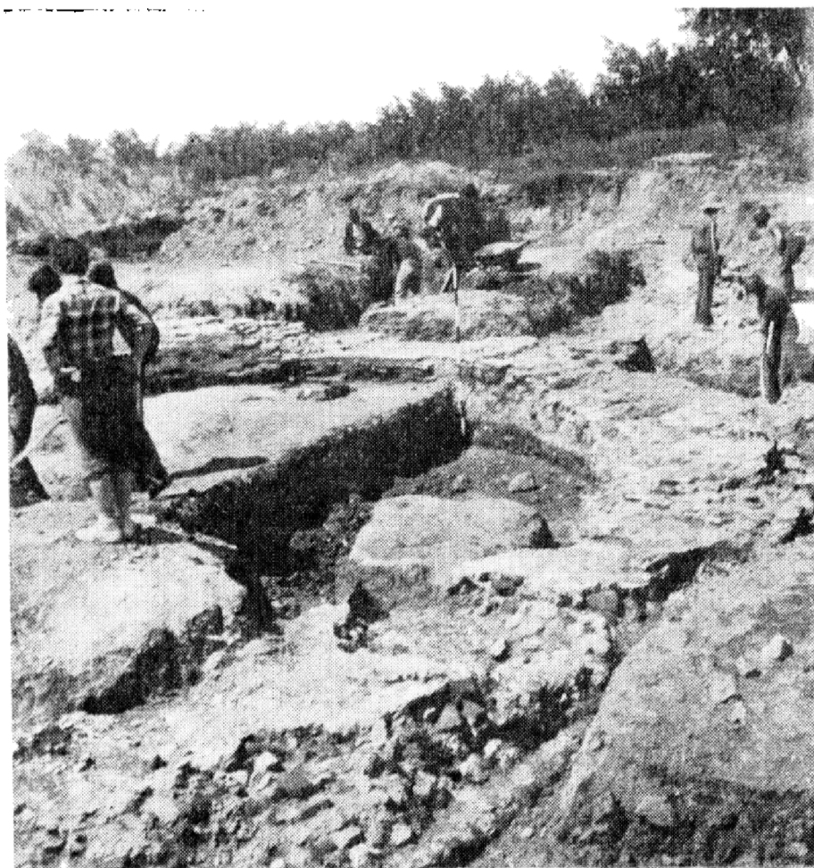
Obr. 4. Košice-Krásna: Pohľad na odkryv muriva rotundy.