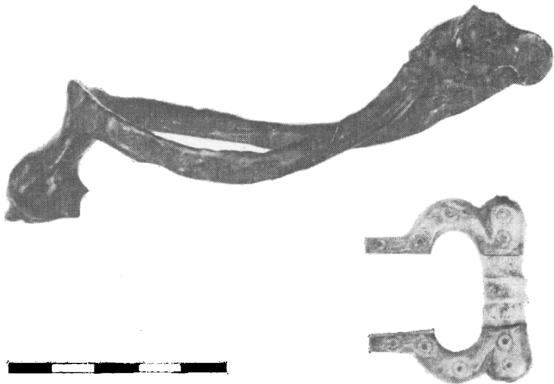
Obr. 4. Bratislava, býv. Pálffyho palác na Nálepkovvej ul. 19–21. Ostroha s ozubeným kolieskom (Sonda 1) 13. stor. Kostenná pracka z troch častí spojených železným drôtom (Sonda 5), 13. stor.