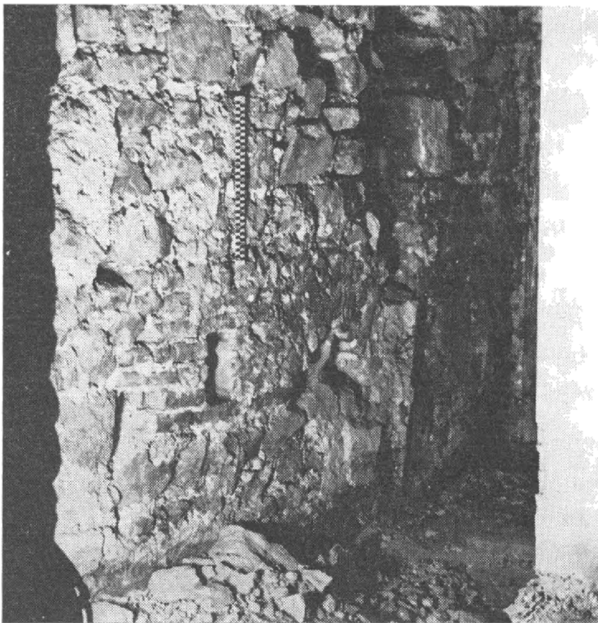
Obr. 3. Bratislava, býv. Pálffyho palác na Nálepkovvej ul. 19–21. Nárožie románskeho objektu z 13. storočia v interiéri miestnosti na 1. poschodí.