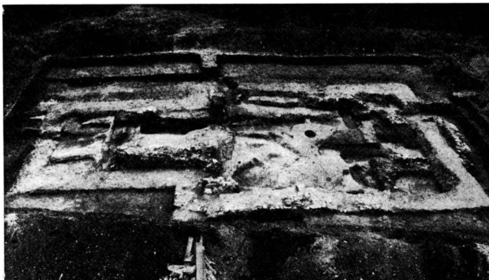
Obr. 3. Zaniklá ves Divice u Brnmovic. Pozůstatky kostela odkrytého v letech 1985–1997 od severa po vybrání většiny hrobů uvnitř kostela.

tohoto sídla však dnes ještě nemáme představu. Po zničujícím požáru někdy ve druhé polovině 13. stol. bylo na lokalitě postaveno nové feudální sídlo a to v podobě „motte“. Snad v této době, nebo možná i o něco později, byl původní kostel nahrazen kostelem větším. Náhled do života Divic umožňují i sporé písemné prameny 14. a 15. stol., v nichž se objevují jména divických feudálů, dvůr, kostelní podací, lány, podsedky a vinice (ZDB III, 451, V, 473, VI, 363, X, 37). Zánik vsi spadá do 15. stol., přičemž šedesátá léta jsou asi nejzazší mezí.