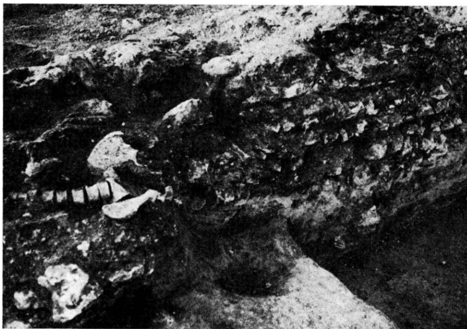
Obr. 5. Zaniklá ves Divíce u Brumovic. Zbytky hrobu (obratle a pánev) narušujícího základy starší fáze kostela.