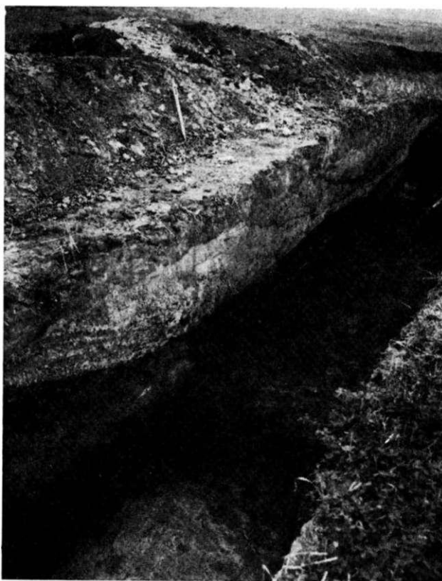
Obr. 1. zaniklá ves Dítice a Brumovic. Na fezu lokalitou „Kostelík“, kteří je pozůstatkem „motte“, je patrné spraiové podloží i původní černozemní vrstva s kulturními pozůstatky. Výrazně barevná odlišené souvrství je pozůstatkem sypání „motte“.

Na základě dosavadního stavu bádání můžeme vývoj Divic shrnout následovně: V první třetině 13. stol. došlo v neosídleném údolí staré sídelní oblasti k založení vesnice Divic. Iniciátorem, organizátorem a držitelem vsi byla šlechtická rodina, z níž známe Předbora a jeho syny Přibyslava, Svěslava a Divu (CDB III, č. 107, str. 133). Záhy zde byl postaven i kostel, pravděpodobně související nějakým způsobem se sídlem feudální rodiny. O přesné lokalizaci, ani podobě