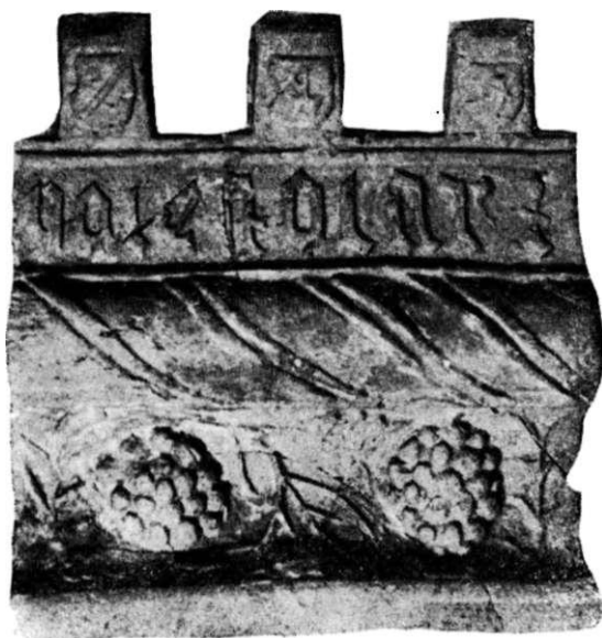
Obr. 2. Celní vyhřívací stěna jednoho ze studovaných kachlů.