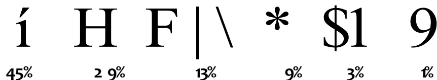
Tab. 1. Bminské poháry.

Datování nálezového celku usnadňují čtyři mince (3-krejcar, Ferdinand II., Brno 1622; malý peníz, Matyáš, Kutná Hora 1617 ?; početní peníz, Vok z Rožmberka, České Budějovice 1608; početní peníz, Hans Krauwinkler, Norimberk 16./17. st.), z nichž nejcitlivější je právě brněnská ražba z roku 1622. Tato mince byla v oběhu jen velmi krátkou dobu a klade zánikový horizont souboru nejpozději do druhé poloviny 20. let 17. st. 1