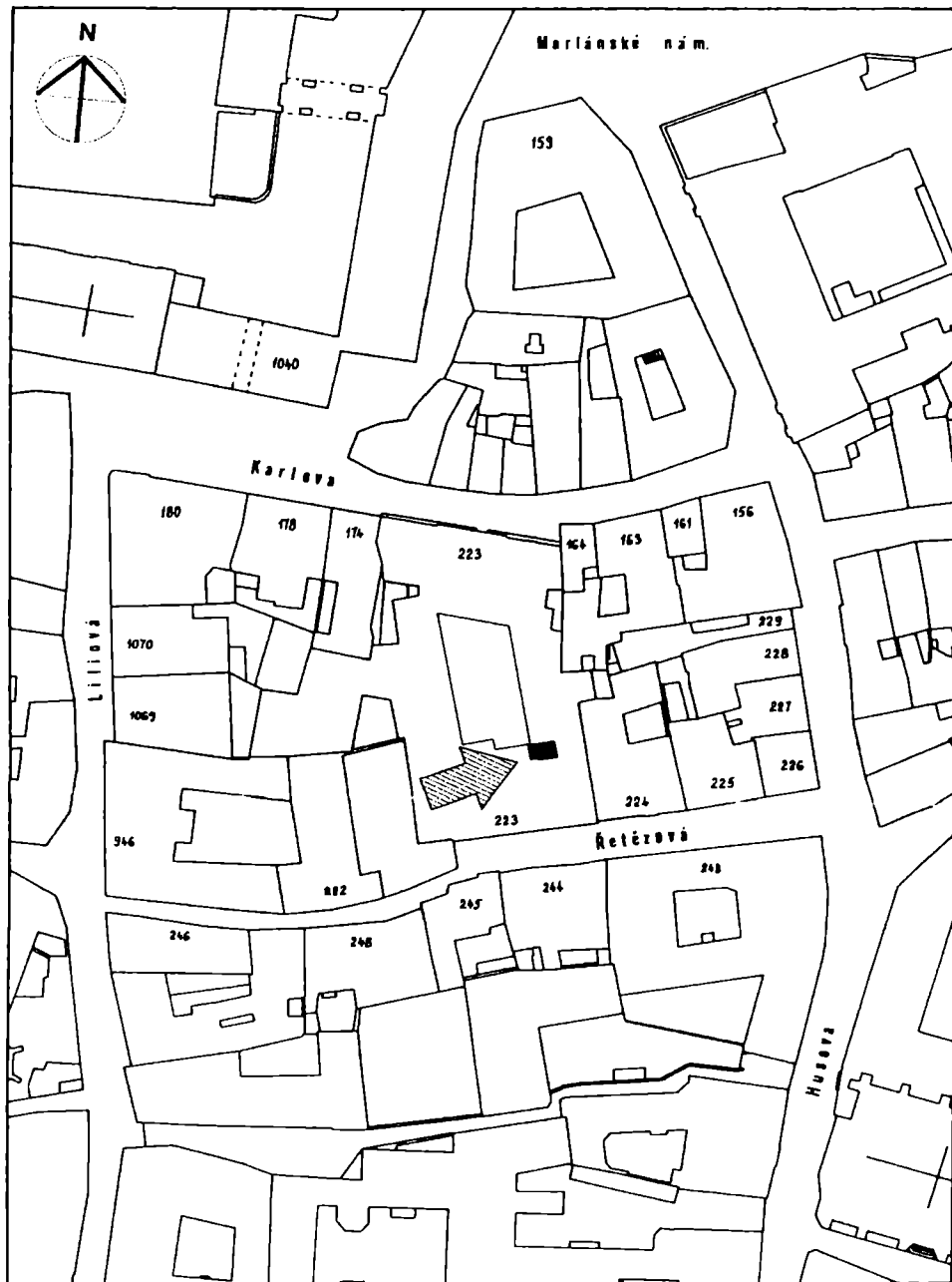
Obr. 1. Situace výkopu v rámci Starého Města pražského. Kresba S. Matoušová.

– jeden tyčinkovitý o trojúhelníkovitém průřezu a váze 300 g, jeden hranolovitý obdélného průřezu o váze 590 g a dva deskovité s otiskem dřevěné formy o váze 350 g. S výjimkou druhé hřivny jsou všechny ostatní značeny různými kříži, poslední dvě mají kříže mezi dvěma linkami a hrotem kopí (Pavelčík 1979, 21). Z původně velkého depotu z Rudimova o celkové váze 150 kg, nalezeného v r. 1928, byly tehdy odebrány pouze vzorky. V popisu