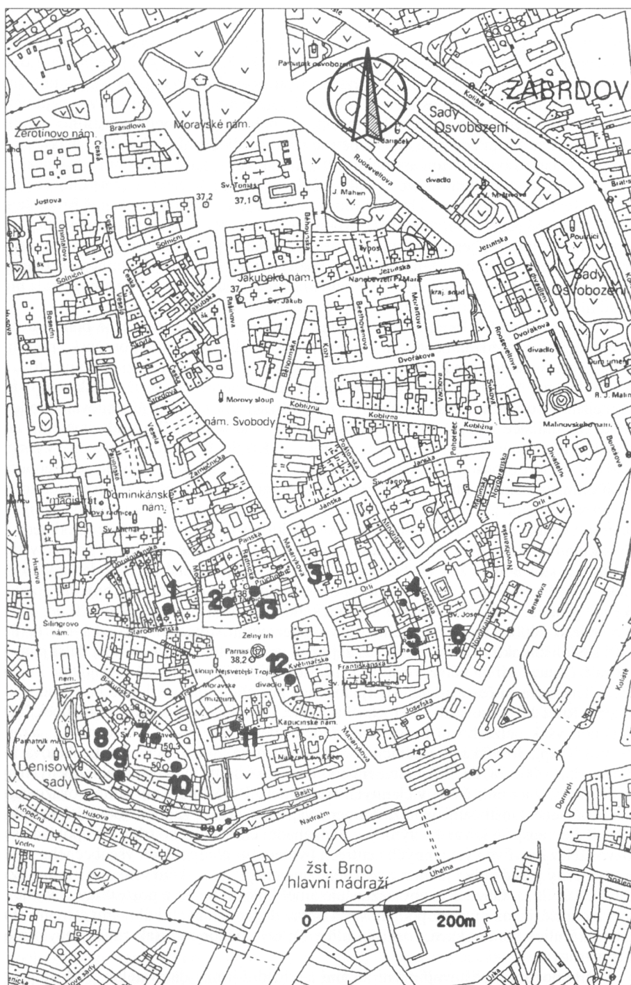
Obr. 1. Brno, předlokační osídlení datovatelné před r. 1200 v prostoru vnitřního města, stav r. 2002. 1 – Starobrněnská 8, 2 – Radnická; 3 – Masarykova 25; 4 – Orlí 16; 5 – Františkánské – plocha tzv. Římského náměstí; 6 – Josefská 7; 7 – plocha severně katedrály sv. Petra a Pavla; 8, 9 – Petrov 8; 10 – kostel sv. Petra – 1. fáze; 11 – Muzejní, komunikace; 12 – Zelný trh 4; 13 – vozovka před Radnickou 8.