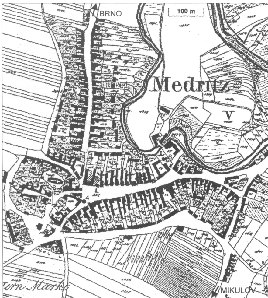
Obr. 4. Modřice – mapa stabilního katastru z r. 1835. 1 – Benešova ulice č.p. 165; 2 – Hybešova ul., náleží středověkého zdiva; 3 – archeologicky zkoumaný areál radnice; 4 – místo pohřbiště 13. stol., 5 – Havlíčkova ulice; 6 – mlýn; 7 – někdejší Krakovská ulice; 8 – kostel sv. Gottharda.

motný hrad, ještě ve 14. stol. třetí nejdůležitější rezidence olomouckých biskupů, zřejmě v průběhu 15. stol. ztrácel na významu; poslední purkrabí je doložen k r. 1406 a jednání týkající se modřického lenního obvodu se odbývala obvykle v Brně (Lechner 1902, např. 230, 55, 56; Doležel 2000, 184). Ještě roku 1274 jsou Modřice označovány jako ves (villa), již r. 1268 zde stál mlýn, jako léno propůjčený jistému Meinardovi. Pravděpodobně r. 1292 a s jistotou r. 1302 poprvé zmíněný rychtář (advocatus) býval obvykle jedním z biskupových manů (CDB V/1, č. 556, 122–124; V/2, 399–401, č. 738; CDM IV, 388, 389, č. 305; CDM V, 143, 144; č. 137).