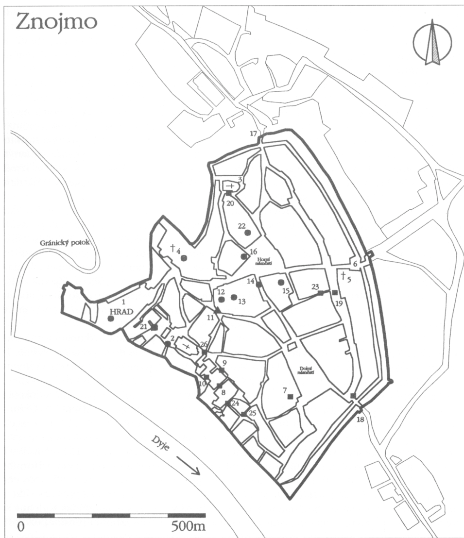
Obr. 2. Znojmo. Lokality se stratifikovanými středověkými nálezy a význačné topografické body. v historickém jádru města. Černé kroužky – mladohradištní nálezy, čtverečky – 13.–13./14. stol., trojúhelník – 12./13. stol.–13/14. stol., datace počátků nejistá. 1 – hrad, místo výzkumu u rotundy; 2 – sv. Mikuláš s karnerem; 3 – sv. Michal; 4 – minoritský klášter; 5 – dominikánský klášter; 6 – střední (východní brána); 7 – nám. T. G. Masaryka č. 21; 8 – Tkalcovská ul.; 9 – U branky 10; 10 – tzv. Kaplanka, ul. U branky 6; 11 – Velká zelenářská; 12 – Václavské nám. 3; 13 – Václavské nám. 1; 14 – Obrokova 2a; 15 – Horní nám. 19; 16 – Horní nám. 8; 17 – Horní brána; 18 – Kollárova – Vlkova věž, Dolní brána; 19 – před Zámečnickou č. 10; 20 – Jezuitské nám.; 21 – V jámě; 22 – Horní nám. 10; 23 – před Kovářskou 10; 24 – Slepá; 25 – U brány; 26 – Velká Mikulášská – Mikulášské nám.

12. stol. Na ni nasedala výrazná vrstva se silným podílem „kolonizační“ podunajské keramiky s počátky asi již v 1. polovině 13. stol. (Procházka 2000a). Nejnověji se podařilo zachytit výraznou mladohradištní vrstvu, dle okrajů zásobnic asi z přelomu 12./13. stol. ve dvoře domu č. 3 na téže náměstí. 8 Intaktní vrstva s keramikou 11./12.–12. stol byla zjištěna při záchranném výzkumu dvorního traktu domu č. 19 na jihovýchodním okraji Horního náměstí. Nacházela se naspu dokumentované stratigrafické sekvence, která ovšem neob-