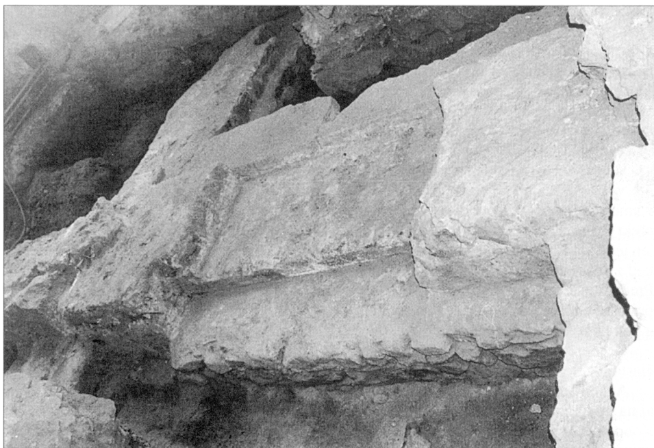
Obr. 4. Bratislava, dóm sv. Martina. Južný múr kostola z 13. stor., západný portál (vstup).