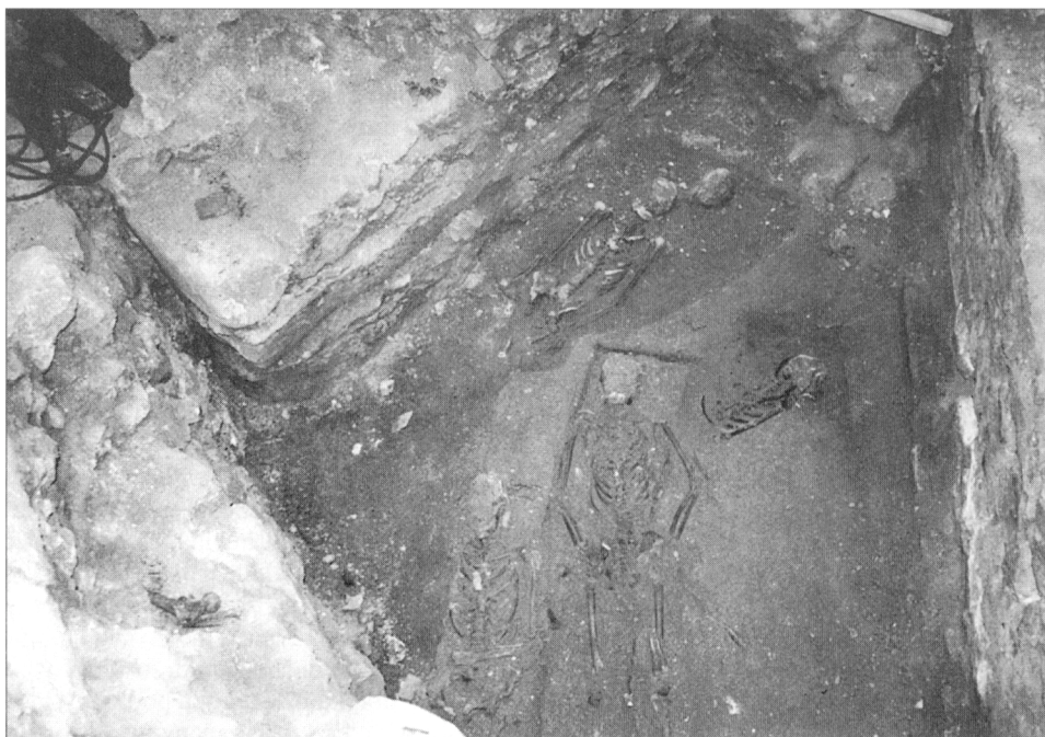
Obr. 3. Bratislava, dóm sv. Martina. Hroby z 12.–13. stor. pred južnou loďou kostola z konca 13. stor.