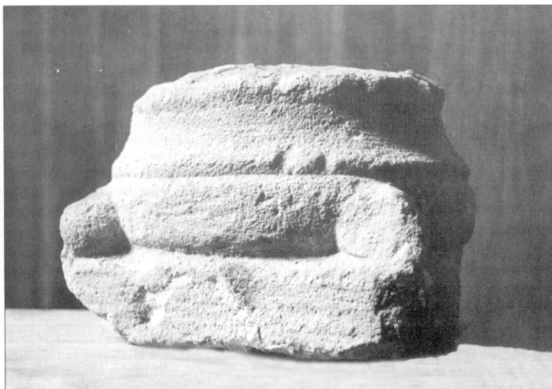
Obr. 5. Bratislava, dóm sv. Martina. Pätká románskeho stĺpiku.

Salvátora a „z kostolnej komory odniesli všetky výsadné listiny a iné majetky“. V rámci nápravy tejto situácie daroval uhorský kráľ Ladislav IV. časť územia dnešnej Petržalky–Flencyndorph (dnes časť Bratislavy) a Zeleneč pri Trnave bratislavskému kostolu sv. Salvátora, a to pre veľké škody, ktoré utrpel v časoch vojny s českým kráľom. Hraničná poloha Bratislavy bola vhodným územím pre prenikanie západných, najmä nemeckých vplyvov, ktoré možno dobre pozorovať aj v materiálnej kultúre, hoci popri nich sa neskôr prejavujú aj vplyvy talianske. To však už presahuje rámec príspevku a zaslúžilo by si zvláštnu pozornosť.