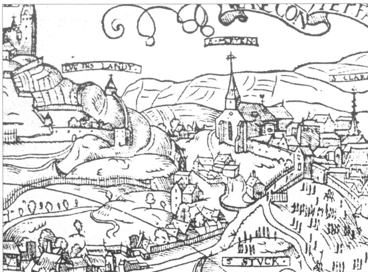
Obr. 1. Bratislava. Najstaršie zobrazenie dómu s pohľadom na Bratislavu. Detail z drevorezu H. Mayera, 1563.

aj fyzicky. Zvyšky predchádzajúceho kostola boli pravdepodobne ešte viditeľné, preto ich pri stavbe začiatkom 11. storočia využili. Na pilieri pôvodného trojlodia postavili pravouhľe sanktuárium nového kostola, múry jeho lode využili tiež zvyšky predchádzajúcich murív.