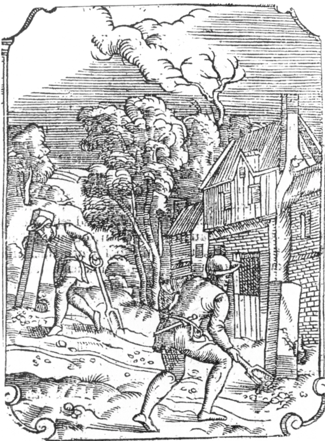
Obr. 1. Přemístění hraničních kamenů bylo považováno za závažný delikt. Dřevořez, Joost Damhouder: Praxis rerum criminalium . Frankfurt 1565, fol. 233r (Kocher 1992, 116).

Tovačovské a dále jej doplňuje. V případě, že nesrovnají-li se svědkové obapolní tak, jakž o tom napřed stojí, tehdy [úředníci] káží vyrýti v zemi hrob, coby v něm čtyři mohli kleknouti, tu, odkudž mají počítí věsti ty meze aneb ohradnice, a prostruč na vymýtané zemi koberec proti východu slunce, položiti naň krucifix a pak vždy po 4 svědcích káží kleknúti do toho hrobu bosým, v košili, prostovlasým beze vši braně a pásu, a tak každý má dva prsty položiti na Boží umučení a takto přísahati po písari, každý jmenujíc se křtěným jménem: „Přisahám pánu Bohu ...“ Drnovská kniha podrobně rozepisuje poplatky a další zabezpečení poskytované úředníkům spornými stranami – obě strany platte jim a při mezích je chovajte jídlem, pitím i obrokem; a také škody, hřebík, podkovu, šín, kolo i kůň, umřel-li by jim zaplatte. Jistá plnění byla poskytována i svědkům a vítěz hraničního sporu mohl neúspěšnou protistranu žalovat o všechny náklady (KDrn, 59–61). Další upřesnění přineslo na základě sněmovního usnesení z roku 1520 moravské zemské zřízení z roku 1535. Zprávu o svědectvích měli menší úředníci před zemským soudem přednést za přítomnosti obou stran, které nesměly proti nim svévolně bez dostatečného důvodu mluvit (ZZ 1535, č. 60, 71).