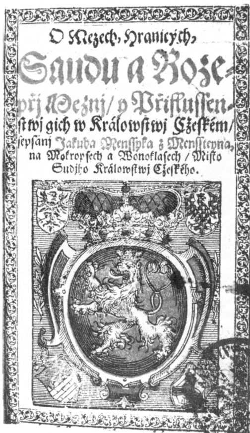
Obr. 2. Jakub Menšík z Menštejna: O meze, hranicích... Praha 1600 (MZA Brno, G 21, inv. č. 533, titulní strana).

o poplatcích, které byl nucen uhradit zemským úředníkům: puolčtvrte hř[ivny] gr[ošů] šir[okých] a od XXIII svědkuov XXIII lotuov gr[ošů] šir[okých] (LCS VI, č. 1932, 319).