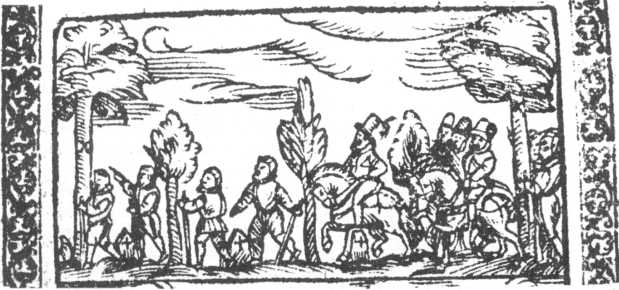
Obr. 3. Jakub Menšík z Menštejna: O meze, hranicích... Praha 1600 (MZA Brno, G 21, inv. č. 533, výřez z dřevorezu – vedení svědků na hranice).