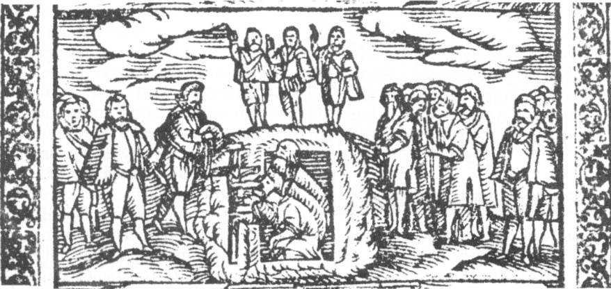
Obr. 4. Jakub Menšík z Menštejna: O meze, hranicích... Praha 1600 (MZA Brno, G 21, inv. č. 533, výřez z dřevorezu – přísaha svědků v hrobě).