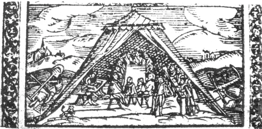
Obr. 5. Jakub Menšík z Menštejna: O meze, hranicích... Praha 1600 (MZA Brno, G 21, inv. č. 533, výřez z dřevorezu – zasedání mezního soudu ve stanu, vedle vyobrazení nářadí k vytýčení hranice).