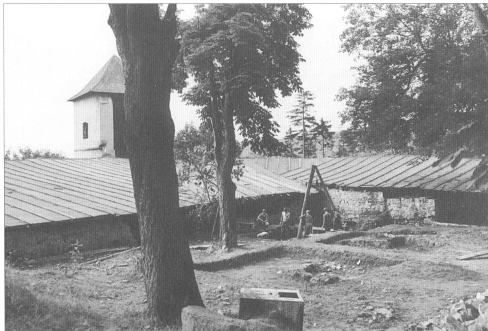
Obr. 1. Výzkum hradu Brumova v roce 1982.

Brumovský hrad, který byl funkční ještě v první čtvrtině 19. století, byl v průběhu následujícího století z převážné míry rozebrán jako zdroj levného a poměrně dostupného stavebního materiálu. Z dochovaných záznamů máme doloženo použití kamene z hradní stavby především při stavbě nových pivovarských sklepů a rozšiřování areálu pivovaru v poslední čtvrtině 19. století, ale značné množství materiálu z hradních ruin bylo použito i při rozšiřování a přestavbě panského dvora dole ve městě. Prakticky již ve 30. letech minulého století byl z hradu dochován jen terénní reliéf, částečně zalesněný. Pouze plocha hradního jádra, kde se díky romantizující stavební úpravě z počátku 20. století dochovalo torzo jihovýchodní bašty, byla později upravena na prostor k pořádání kulturních akcí „pod širým nebem“. Po roce 1972 byla prosazována snaha vybudovat v tomto prostoru areál letního kina