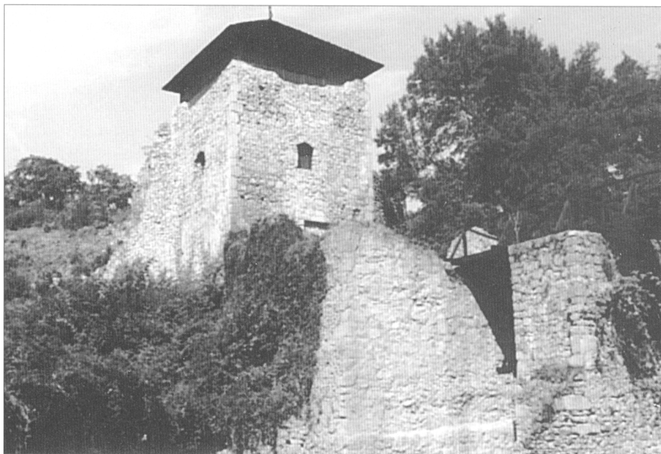
Obr. 7. Hrad Lukov – vstupní věž po rekonstrukci.