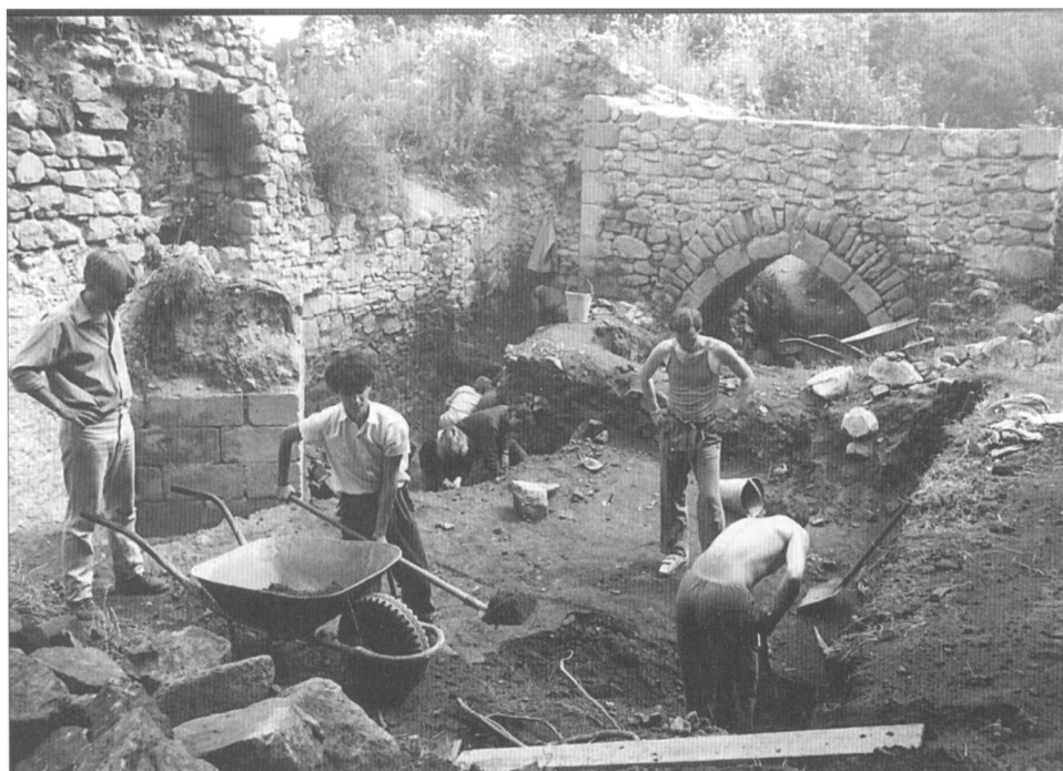
Obr. 5. Výzkum hradu Lukova (jižní parkán) v roce 1989.