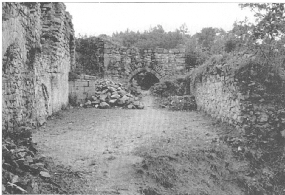
Obr. 6. Hrad Lukov – jižní parkán v současnosti.