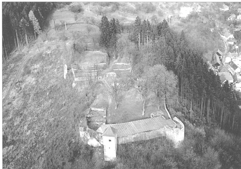
Obr. 3. Letecký pohled na hrad Brumov – současný stav po rekonstrukci.