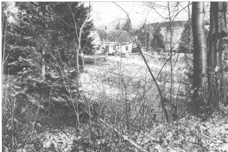
Obr. 2. Ondřejovice, jádro tvrziště s domem čp. 76, pohled od západu, listopad 2005.

z nasucho kladeného lomového kamene jsou šikmé, dnes dosahuje hloubky zhruba 1,7 m oproti úrovni okolního terénu.