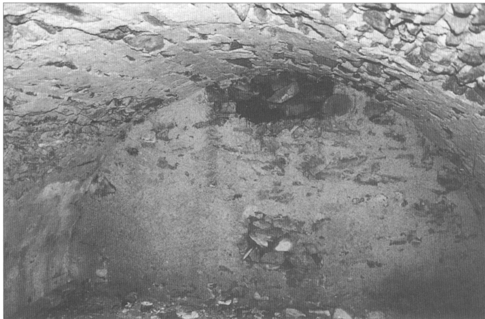
Obr. 3. Ondřejovice, valeně klenutý sklep v severozápadním úseku tělesa valu, listopad 2005.

Naposledy se objektem zabývali František Musil a Miroslav Plaček v roce 2003 ( Zaniklé hrady, zámky a tvrze Moravy a Slezska . Praha, zde na s. 121–123). Autoři nejprve stručně