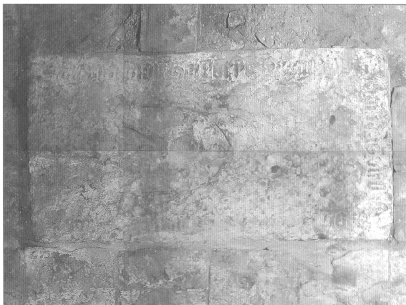
Obr. 3. Náhrobní deska s erbem s nezřetelným erbovním znamením a opisem gotickou minuskulou.