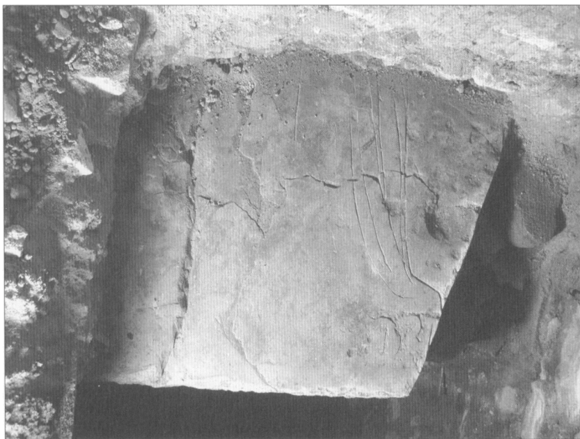
Obr. 5. Torzo náhrobní desky z jižního ramene ambitu, vlevo keramické dlaždice.

Ostatní náhrobníky náležejí již k pohřbům významných měšťanů nebo měšťanských rodů. Druhý exemplář desky nad hrobkou je vytesán ze sliveneckého mramoru a má dochovaný rozměr 143×90 cm při síle desky 11 cm, při čemž šířka je kompletně dochovaná. Uražená horní část obsahuje část nápisu humanistickou majuskulou s datem 1602, ve spodní partii je štípený erb s polovinou orlice v pravé části a trojicí břeven v lehkém pokosu v levé. Podle erbu se jedná o rodový znak Turků z Rozenthalu v provedení před jeho polepšením v roce 1649 (Fiala–Hrdlička–Županič 1997, 121–124, obr. 88), tedy ve formě, kterou známe i z nedávného nálezů torza malované láhve, pocházející z domu U Vejvodů, sídla tehdejšího staroměstského primátora Mikuláše Františka Turka ze Šturmfeldu a Rozenthalu (Dragoun–Dragoun 2005, 107, 109). Dva dochované otvory pro zakotvení úchytů sloužících k vyzvedávání desky včetně žlábků pro zapadnutí k tomuto účelům používaných kovových kruhů jsou v dolní části náhrobníku, zbývající dva byly zjevně v nyní odlomené partii. Ani tato deska svými rozměry neodpovídá zmíněné kryptě v rohu lodi.