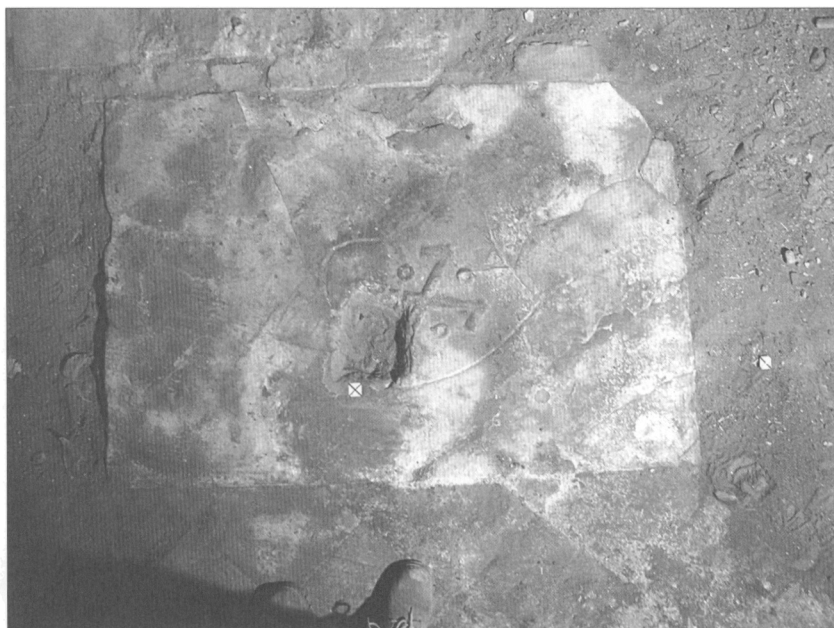
Obr. 2. Náhrobní deska s renesančním kolčím štítem.

Popsaná situace v západní části chrámu se dnes výrazně liší od východní partie, kde proběhl v 50. letech minulého století hloubkový archeologický výzkum. Publikování výsledků archeologického výzkumu ve východní části klášterního kostela sv. Anny se v minulosti logicky soustředilo na prezentaci tehdy odkryté rotundy a templářského kostela sv. Vavřin-