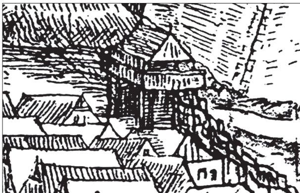
Obr. 2. Výrez z druhej Willenbergovej veduty zobrazujúci jednu z drevených brán na západnej strane mestského opevnenia v roku 1599.

námestia – in fossatis circuitus civitatis (MZ 1499). V tomto prípade však podľa vynaloženej sumy išlo už o väčšie stavebné úpravy priekopy. Mesto za ne totiž vyplatilo spolu sumu 6 zlatých a 25 denárov. Zvolenský mešťania zároveň v tom istom roku opravovali aj priekopu, ktorá ležala na ulici blízko domu mešťana Škrtlíka – in platea penes skrtliq. Zatiaľ nevieme, či išlo o označenie úseku veľkej priekopy okolo celého námestia, alebo o inú samostatnú priekopu – súčasť mestského opevnenia. Mestská priekopa vyžadovala podľa