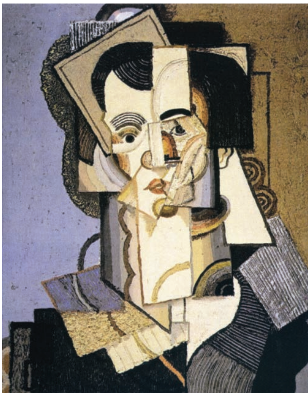
7 – Antonín Procházka, Dáma ve svetru , 1921. Brno, sbírka Karla Ditricha, 1945 (dnes Národní galerie v Praze, inv. č. O 9013)

objevilo v obrazové příloze monografie Jaromíra Pečírky z roku 1945, když současně byly zapůjčeny na první posmrtnou výstavu v Olomouci v listopadu 1945. Následovaly další zápůjčky na poválečné přehlídky malířova životního díla uspořádané v brněnském Domě umění (1946) a v pražském Mánesu (1947). Na oficiální výstavu československého umění, kterou v roce 1947 uspořádal odbor pro kulturní styky Ministerstva informací v prestižní londýnské Whitechapel Art Gallery a dalších anglických galeriích, zapůjčil Procházkův autoportrét z roku 1908. [Příloha II, č. 2; obr. 3] Bylo to již v době, kdy Ditrich po otevření výstavní a aukční síně přesunul své aktivity zcela do komerční sféry, 13 a kdy se do jeho zorného pole obchodníka i sběratele stále více dostávala numismatika. Poté, co byla na jeho firmu v prosinci 1948 uvalena národní správa, působil jako člen několika numismatických společností doma i v zahraničí (Numismatická společnost československá, American Numismatic Association, Numismatic Society of South Australia, Österreichische numismatische Gesellschaft, Circolo Numismatico Napoletano), nadále v Brně a následně v Praze jako přísedící soudní znalec z oboru numismatiky a intenzivně se věnoval budování své sbírky mincí.