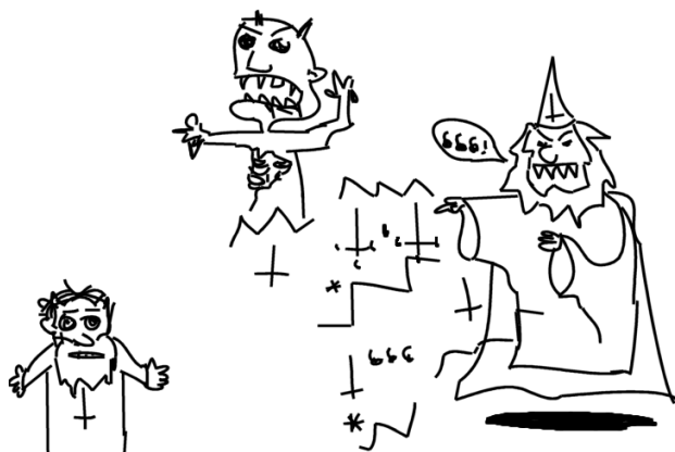
Obr. 3. Entranced by the Northern Impaled Necrowizard's Blasphemous Incantation Amidst the Agonizing Abomination of the Lusting Necrocorpse.

ENTRANCED BY THE NORTHERN IMPALED NECROWIZARD'S BLASPHEMOUS INCANTATION AMIDST THE AGONIZING ABOMINATION OF THE LUSTING NECRO CORPSE