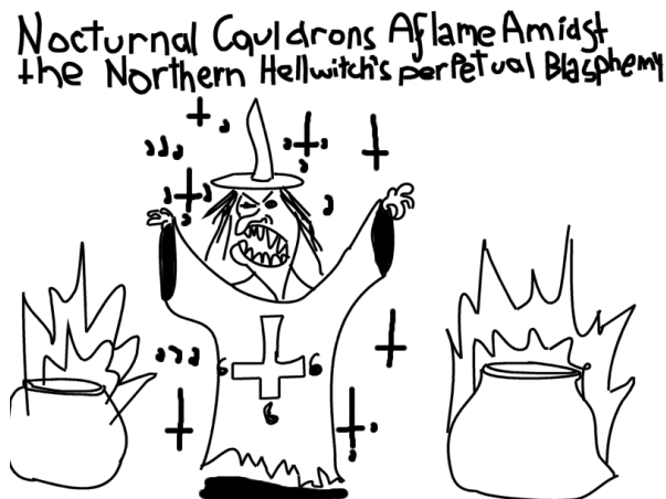
Obr. 2. Nocturnal Cauldrons Aflame Amidst the Northern Hellwitch's Perpetual Blasphemy.

Nejčastěji se objevující bytostí je kozel (goat, 4), což je pro jeho symbolickou ústřednost v satanismu nepřekvapivé. Satan (2) v názvech figuruje také a v některých skladbách je dokonce možné rozpoznat výkřiky: „Satan!“, „Devil!“ 27 nebo „Satan smells!“ 28 Pekelná čarodějnice (hellwitch, 1) je však poslední bytostí, kterou by bylo možné řadit mezi klasičtější satanistické motivy.