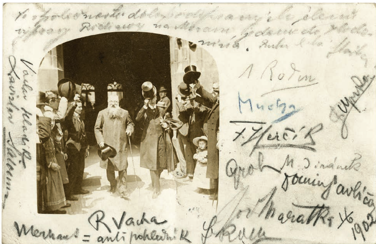
4 – Auguste Rodin před Staroměstskou radnicí v Praze, 1902.

tace. Když František Xaver Harlas (1865–1947) komentoval Rodinovu výstavu v Praze, započal text slovy: „bez předcházejícího reklamního vyzvánění otevřely se místnosti elegantního pavilonku pod Petřínem.“ 41 Poukazem k „elegantnímu pavilonku“ pod Petřínem se dostáváme k dalšímu významu pražské rodinové přehlídky pro Prahu a pro celé Čechy. Nejde o jeho významy, ale výlučně o podobu prostředí, jímž Rodin – obrazně řečeno – procházel. A tu upoutá nápadná ornamentace Rodinovy návštěvy jako sui generis secesně aranžované festivity nebo lépe řečeno sledu festivit. Nepodílí se na ní pouze Kotěřův výstavní pavilon s hlavním prostorem, upraveným jako zimní zahrada, 42 plakát Vladimíra Županského a pozvánka Maxe Švabinského, ani pouze výstavní katalog, jakkoliv zaujme pro svůj pozoruhodně úzký protáhlý formát (189 × 98 mm) se secesním dekorativním motivem a secesně stylizovaným písmem na titulním listu. 43 Spíše překvapí, že na pražské výstavě se prodával ve dvou verzích také plakát Rodinovy pařížské výstavy v roce 1900 od Eugena Carriére. Naopak na ornamentaci se nepodílela zasedací síň Staroměstské radnice 44 – historizující interiér s kazetovým stropem a neorenesančními detaily – protože ta byla zvolena pro setkání Augusta Rodina se zástupci korporací viditelně z nouze, jelikož prostředky stylově korespondující s estetickým vyzněním obdobných akcí nebylo k dispozici; poskytl je až Reprezentační dům hlavního města Prahy (1905–1912). Avšak už ban-