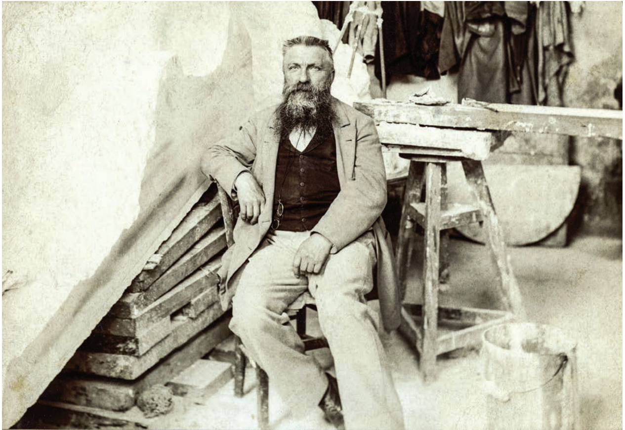
1 – Auguste Rodin

shody a odlišnosti mezi francouzským, tj. románským a německým, tj. severským, germánským sochařským projevem. Rodinovy sochy a kresby na výstavách v německých městech v tomto smyslu skýtaly příležitost upozornit na rozdíl mezi smyslovým a intelektuálním východiskem tvorby: první například právě Rodin, druhou Max Klinger (1857–1920). 18 Jiné východisko analýzy Rodinových děl poskytlo dílo další velké sochařské osobnosti, belgického mistra Geoga Minne (1866–1941). 19 Stranou nezůstalo ani titánství , ona ambivalence mezi jedinečností a současně osamocенostí umělce, jež láká ke srovnání Rodina s Michelangelem (Julius Meier-Graefe). 20