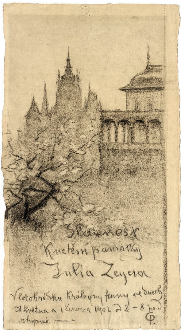
6 – Olga Teofila Pikhartová, Plakát k Zeyerově slavnosti v Letohrádku královny Anny , 1902. Muzeum umění v Olomouci, inv. č. K 126

prostor, jež soudobý žurnalista popsal takto: „Největší [...] sál proměněn jest v háj svěží zeleně, v níž skví se bílé sádrové, bronzové a mramorové skupiny, pomníky, sochy a portréty co perly, což působiti bude najisto na návštěvníka dojmem úchvatným, nezapomenutelným.“ 55 Instalační praxe doplňovat umělecká díla na výstavách vzrostlou zelení v dekorativních nádobách byla ve Vídni běžná a ostatně ještě i IX. výstava Vídeňské secese v lednu 1901 byla jí ovlivněna, ačkoliv právě rodinová sekce již mířila dál, k prázdnému prostoru, v němž stěny vytvářejí nikoliv interiér , tj. konkrétní prostor lidského měřítka s jistým stupněm zabydlenosti (běžným instalačním doprovodem byl například sedací proutěný nábytek nebo koberce, tedy pokoje , dvoranu , salon ), nýbrž chrám , jehož duchovní rozměr dale-