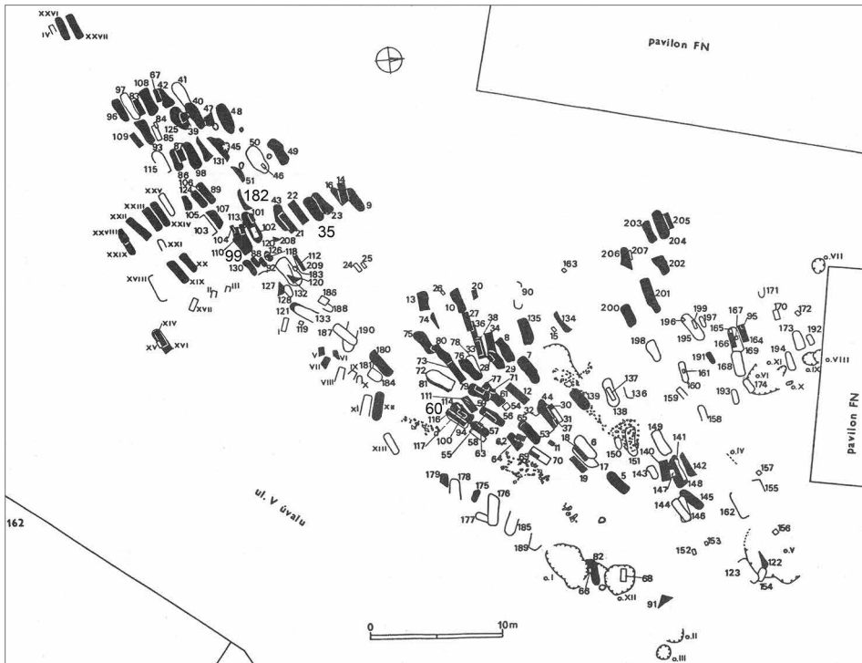
Obr. 3. Pohřebiště Motol, černé hroby s kameny, uspořádané v řadách severozápadně od pravděpodobně dřevěného kostela na prázdné ploše. Čísla 35, 60, 99 jsou čísla hrobů s náhrobním kamenem, v hrobě 182 stál kámen s reliéfem maltézského kříže. Podle Kovářík 1991, obr. 6, doplněno.

Abb. 3. Gräberfeld Motol, schwarz – Gräber mit Steinen, in Reihen nordwestlich der wahrscheinlichen Holzkirche in der Freifläche. Die Ziffern 35, 60, 99 bezeichnen Gräber mit Grabstein, in Grab 182 stand ein Stein mit dem Relief eines Malteserkreuzes. Nach Kovářík 1991, Abb. 6, ergänzt.