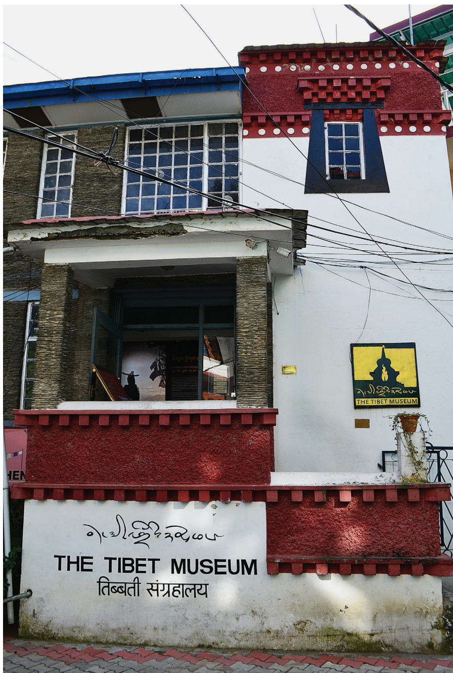
Obr. 4: Průčelí Tibetského muzea, které svými motivy odkazuje na typickou tibetskou klášterní architekturu.

a „Vize budoucnosti Tibetu“. Jak s odkazem na Stephena Hartnetta poznamenává Lisa Keränen, muzeum ve svých vyprávěních využívá rétoriku tzv. katastrofického svědectví („catastrophic witnessing“): „strategii, která nestojí ani tak na představě nezávislého Tibetu, jako spíše na líčení krutých čínských zločinů takovým způsobem, že