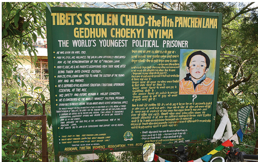
Obr. 3: Informační deska upozorňující návštěvníky chrámu na problematiku „ukradeného dítěte a nejmladšího politickém vězně světa“, Gendün Chökji Njima (autorská fotografie).