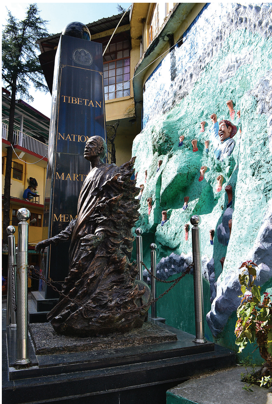
Obr. 2: Tibetský národní památník mučedníků se zpodobněním mnicha v plamenech, komplex chrámu Cuglakhang.

sebeupálení jsou vykresleni jako mučedníci bojující za svobodný Tibet. V areálu komplexu motiv sebeupalování návštěvníka také nemine: přímo před budovou muzea se nachází Tibetský národní památník mučedníků, vedle něhož se tyčí socha mnicha v plamenech (viz obr. 2). Jak již bylo naznačeno, tématu sebeupalování se věnují i výstavy TM a jeho webové