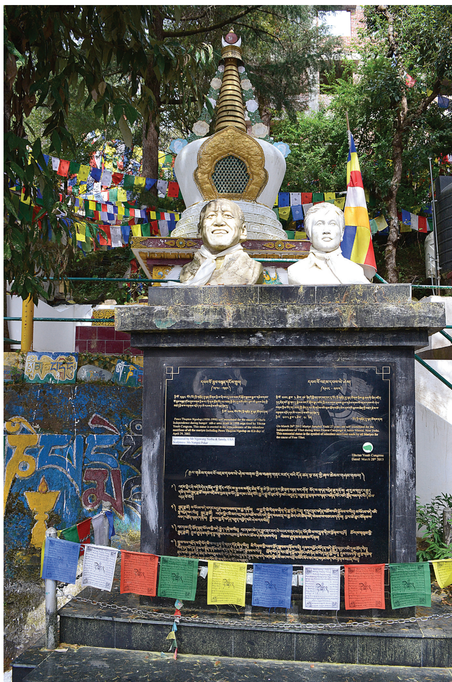
Obr. 1: Busty sebeupálených mučedníků z okolí komplexu Cuglakhang.