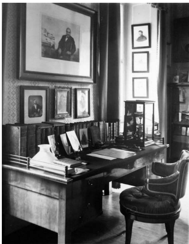
8 Pracovní stůl Františka Ladislava Riegra v jeho pracovně v Malči, stav v meziválečném období.

Palacký věnoval až pedantickou péči každodennímu pozorování počasí a zaznamenávání si meteorologických údajů do svého deníku. 138