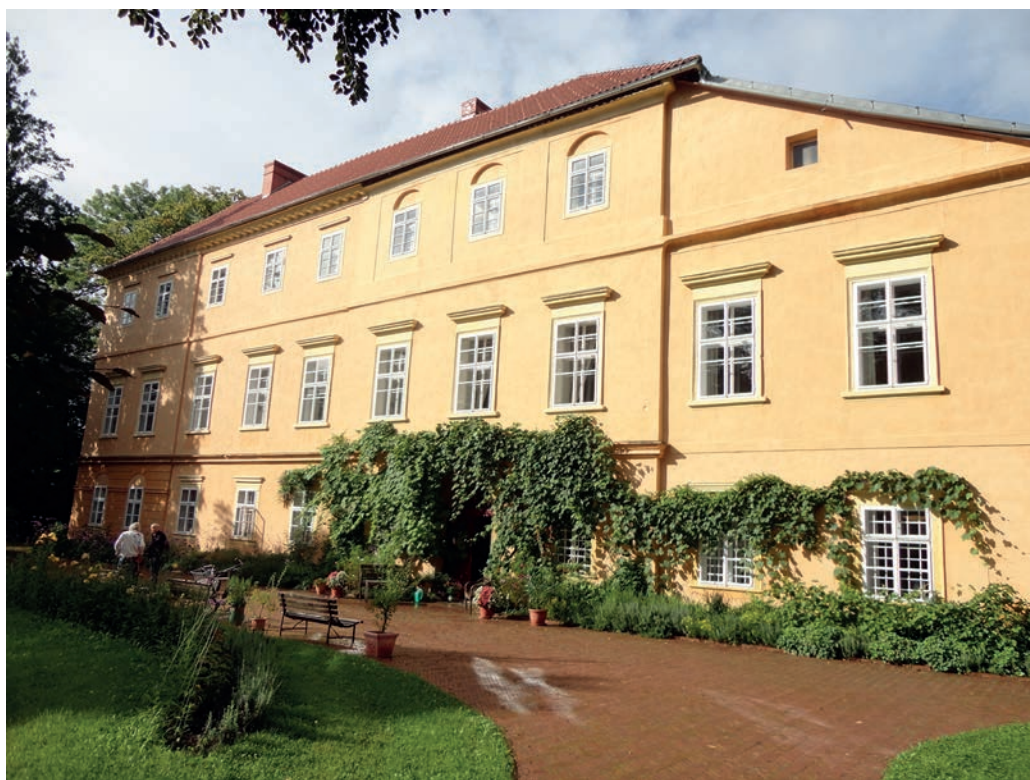
1 Zámek Maleč, dnešní stav.