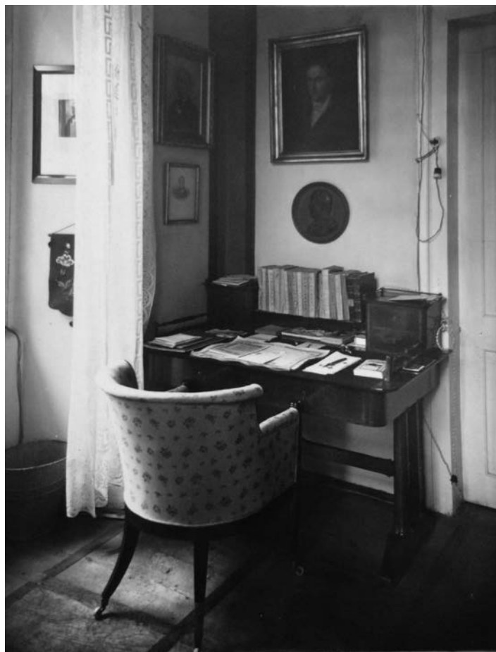
4 Pracovna Františka Palackého v Malči, stav v meziválečném období.