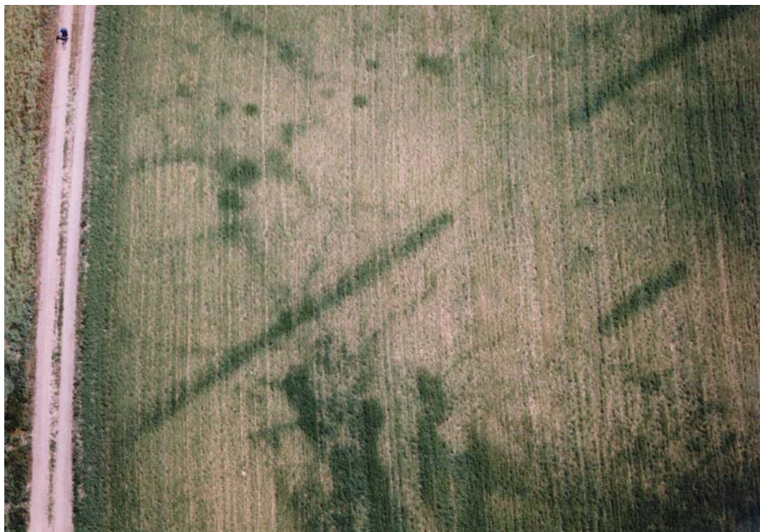
Obr. 4. Přibice I, římský krátkodobý tábor. Brána tábora, kde zelené porostové příznaky vyznačují průběh příkopů Fig. 4. Přibice I, Roman temporary camp. The camp gate where the green crop marks indicate the ditches

Přibice III, další tábory po mnoho let při letecké prospekci objeveny nebyly. Zdá se, že její schopnosti se vyčerpaly. Doufejme, že ne natrvalo.) Přibývaly pouze fotografie doplňující informace o některých detailech, například o jedné z bran tábora Přibice I (obr. 4). V průběhu dalších sezón bylo možné studovat složité situace, o kterých bychom bez leteckého průzkumu vůbec nevěděli (obr. 5).