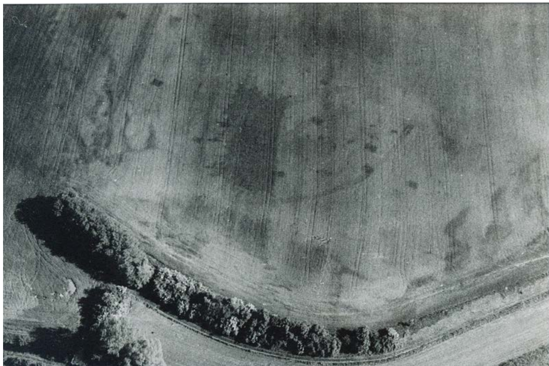
Obr. 3. Rajhradice, U porodny. Sídliště z doby stěhování národů. Kopie fotografie zhotovené roku 1990 Miroslavem Bálkem; používali jsme ji v terénu v průběhu průzkumů