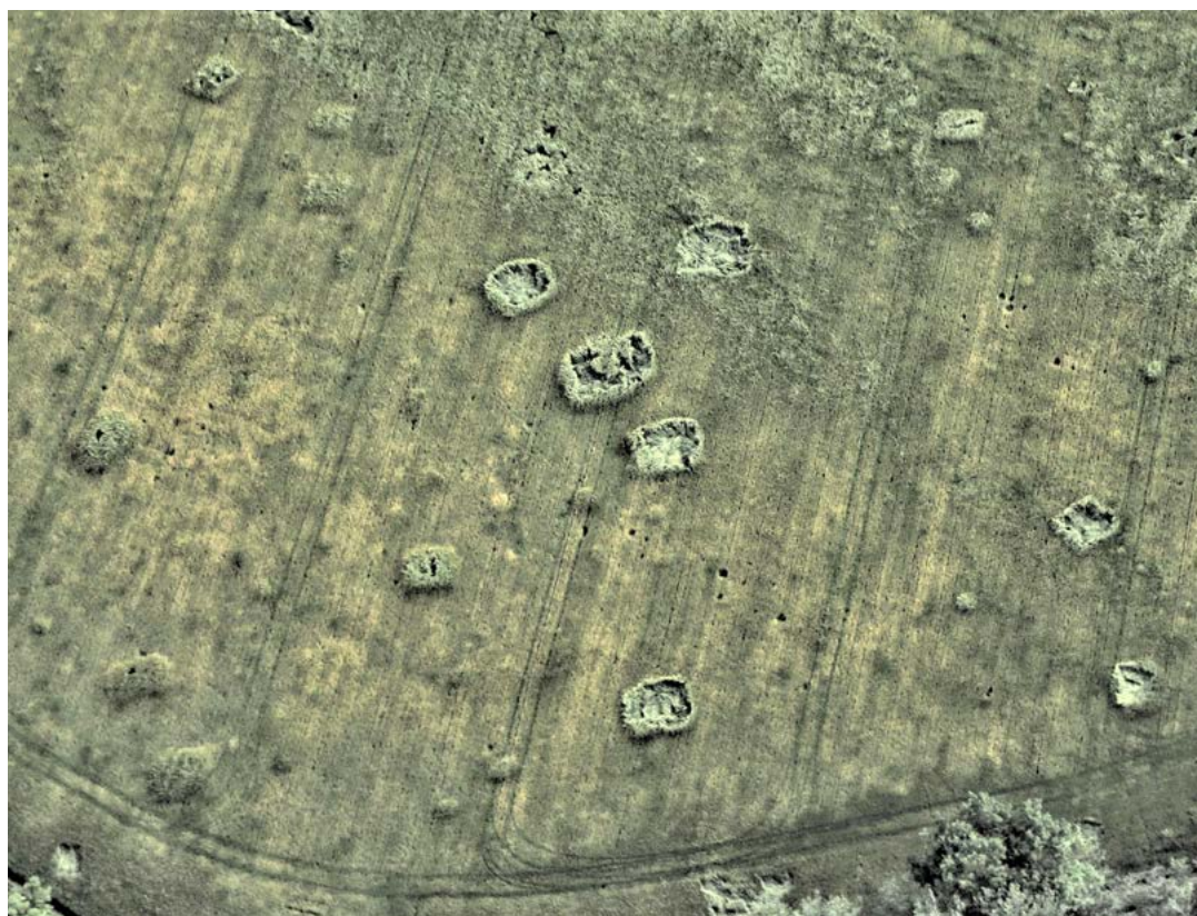
Obr. 6. Nová Ves u Pohořelic, Hektary. Sídlištní objekty, část zřejmě patří do nejmladší části doby římské. Středů nejhlubších kvadratických objektů jsou vyznačeny polehlým obilím