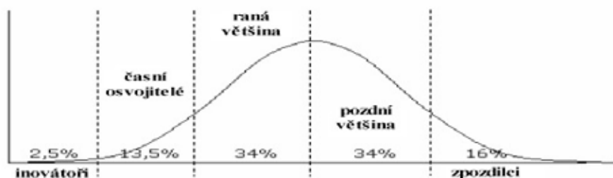
Obr. č. 2 Rogersova křivka 5

Rogers (1995) rozčlenil pět kategorií osvojitelů podle toho, v jaké fázi inovace si ji jednotliví členové sociálního systému osvojují. 4 Na obr. č. 2 je znázorněno zastoupení skupin osvojitelů inovace v populaci. Osa x představuje průběh inovace v čase, osa y relativní procento osvojitelů. Křivka je asymetricky rozdělena, v levé části se nacházejí 3 skupiny osvojitelů, v pravé dvě. V následující části textu představíme dominantní charakteristiky jednotlivých skupin osvojitelů inovací.