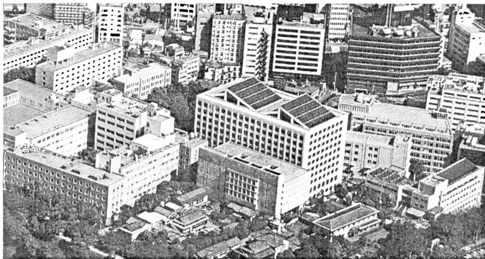
Sophia University, Tokyo

se seznámil s mladým japonským knězem, který mě, když se dozvěděl o mém úmyslu hlásit se do misíí, pozval do Japonska. První čtyři roky v Japonsku jsem se věnoval studiu japonštiny a napsal a obhájil na církevní filosofické fakultě univerzity Sophia doktorskou dizertaci o pojmu objektivitě u Karla Jasperse. Samozřejmě byla taková exulantská kariéra možná pouze v rámci zázemí, jaké poskytuje svým členům mezinárodní řeholní společenství. Na studium teologie jsem se vypravil jako novopečený Dr.phil. do Frankfurtu nad Mohanem. Zapsán jsem byl na Teologické fakultě SJ. Sankt Georgen. Mohl jsem se tehdy účastnit filosofických seminářů, které na frankfurtské univerzitě společně pořádali Max Horkheimer a Theodor W. Adorno. Diskuse v tomto akademickém kruhu mi otvíraly nové perspektivy a vhodně doplňovaly program teologické fakulty.