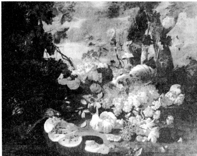
1. C. Roettenbach, Zátiší s ovocem. Zámek Opočno.