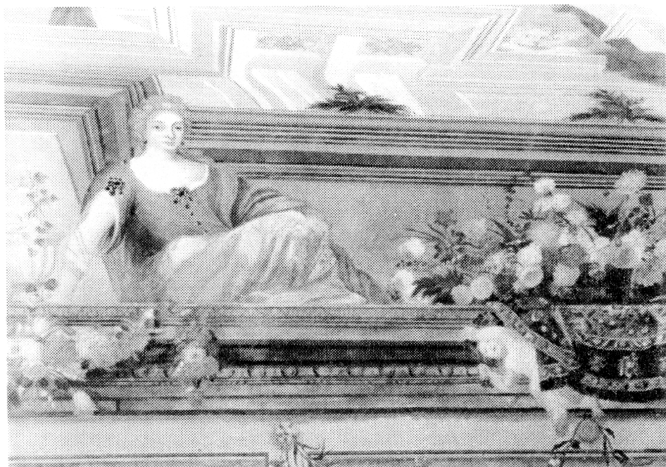
3. C. Roettenbach, Nástrovní malba v zámku v Troji.