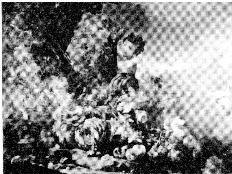
2. C. Roettenbach, Zátiší s ovocem a putti. Zámek Vizovice.