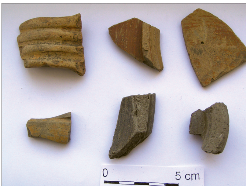
Obr. 1. Božice, provinciální keramika (cihlové a šedé barvy).

Poněkud více artefaktů než z eneolitu se podařilo získat z doby římské. Nálezy byly opět roztroušeny v nevýrazných koncentracích soustředěných v jižní části lokality blíže k toku Jevišovky. Z tohoto prostoru pochází kolekce keramiky a také většina zvířecích kostí a mazanice. Soubor keramiky můžeme rozdělit na dvě části. Jde jednak o domácí „germánskou“ keramiku a dále o importované „římsko-provinciální“ zboží. Střepy domácí keramiky (6 fr.) se vší pravděpodobností pochází z hrncovitých i mísovitých nádob (t. 2300) zhotovených v ruce (DROBERJAR 1997, 51, Abb. 35). Z výzdoby můžeme jmenovat: řádky trojúhelníkovitých vrypů, žlábků a rýhy, ryté trojúhelníkovité pole (DROBERJAR 1997, 31, 34, Abb. 16, 19). Na popisovaném materiálu nebyly zjištěny stylové znaky typické pro horizont C1b, vytyčený J. Tejralem (1998a, 183, 186, Abb. 2). Lze tedy konstatovat, že získaný soubor domácí keramiky odpovídá starořímské keramické škále z 2. stol. a poč. 3. stol. (TEJRAL 1992, 412; týž 1998a, 181, 183, Abb. 1).