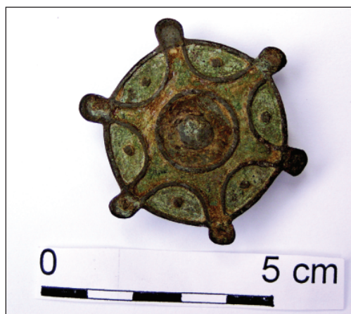
Obr. 3. Božice, terčovitová spona typu Exner III 24.

Unikátní nález představuje bronzová (?) terčovitá spona (obr. 2, 3) zdobená technikou cloisonné. Nález je v moravském nálezovém fondu doposud ojedinělý (srov. PEŠKAŘ 1972; TEJRAL 1998b; MUSIL – ONDŘEJOVÁ 2001). K zajištění artefaktu došlo přibližně ve středu uvedené elevace. Terčovitá spona je zdobena po obvodě šesti výčnělky. Cloisonné výzdobu nese šesticípá hvězdice, která je vepsána do terče.