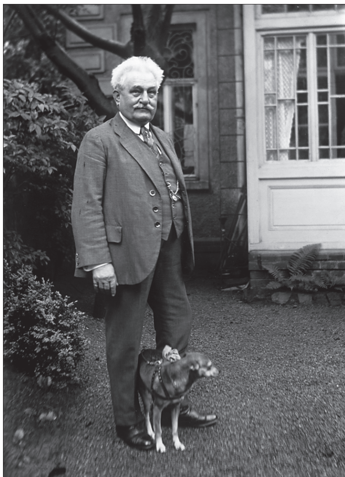
4. Leoš Janáček 20. 5. 1926, krátce před zkomponováním Glagolské mše