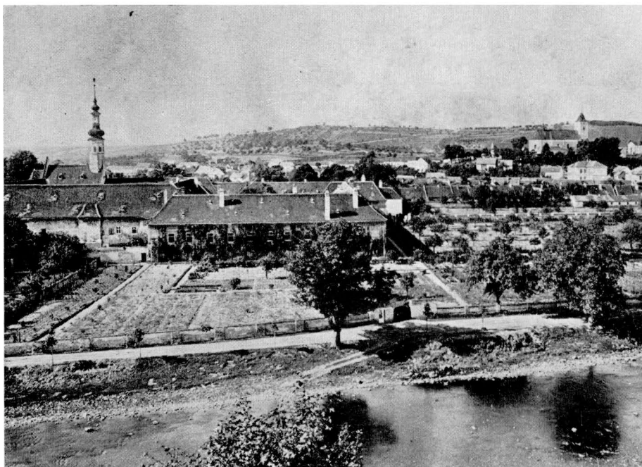
70. Oslavany v letech devadesátých