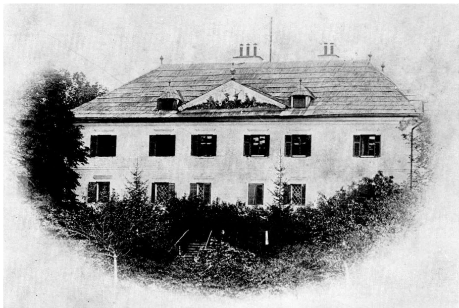
76. Jelenik (Hirschenau) v Korutanech