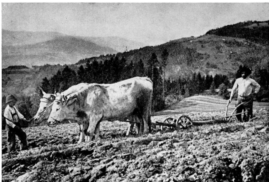
77. Práce rolníka v Lavantském údolí v Korutanech