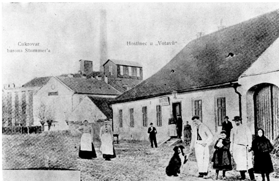
71. Pohled z Oslavan v letech devadesátých