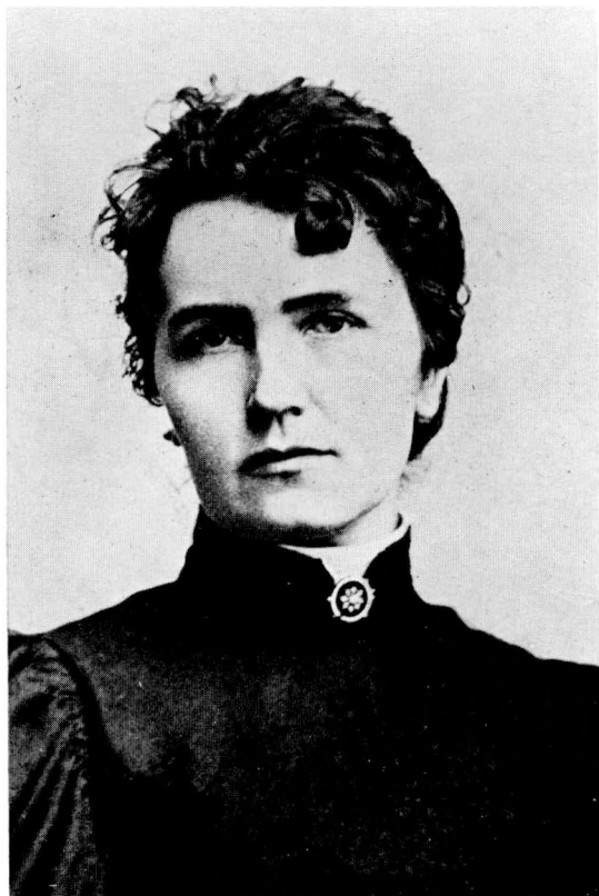
79. Gabriela Preissová koncem let devadesátých