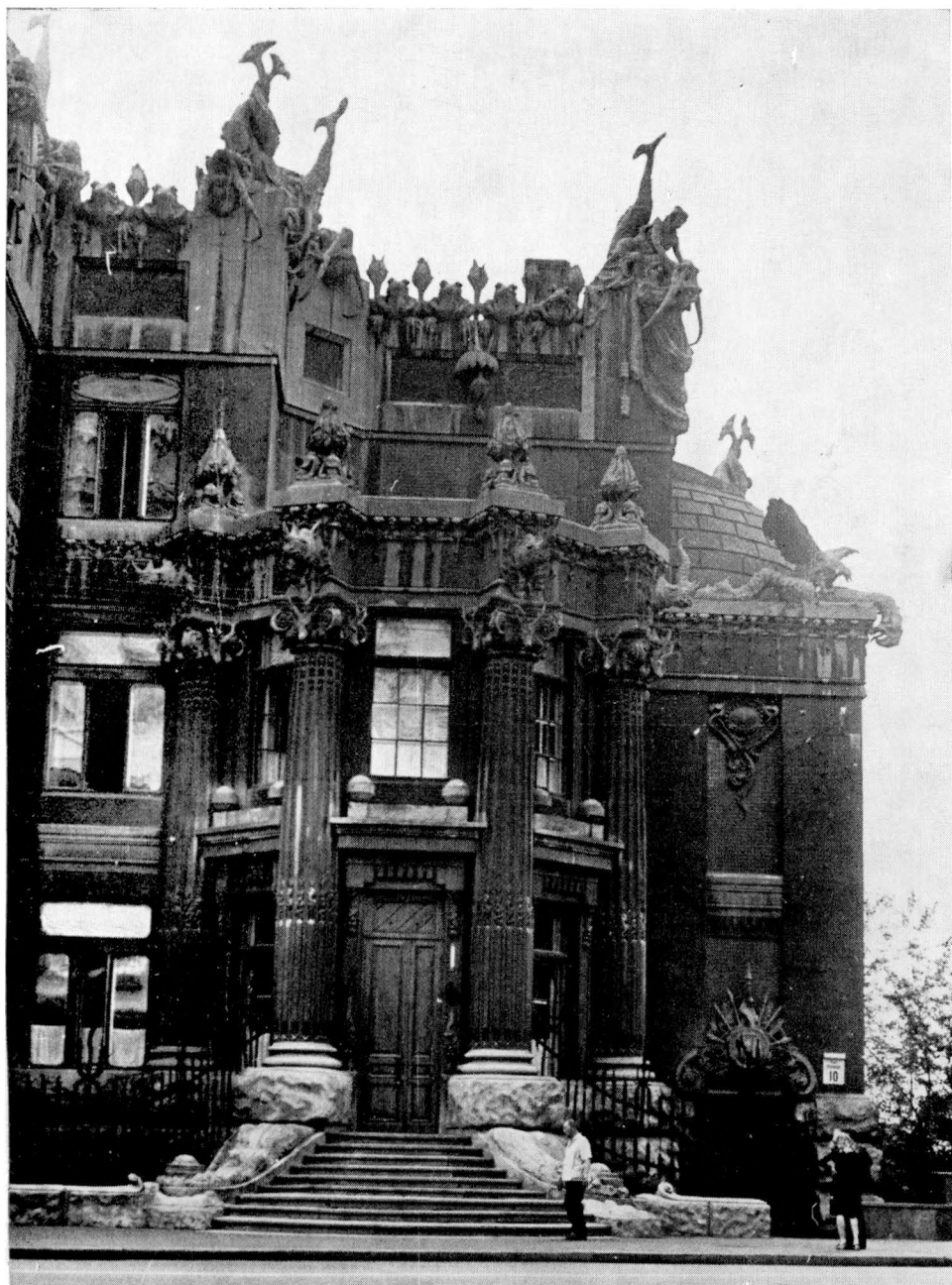
Dům ing. arch. Goroděckého, 1902—1903, na někdejší Bankovské ulici v Kyjevě, zdobený africkou faunou na památku lovecké kariéry majitele a projektanta domu. Autorem sochařské výzdoby je Ital E. Sala. Přední fasáda. Ke kap. VI.