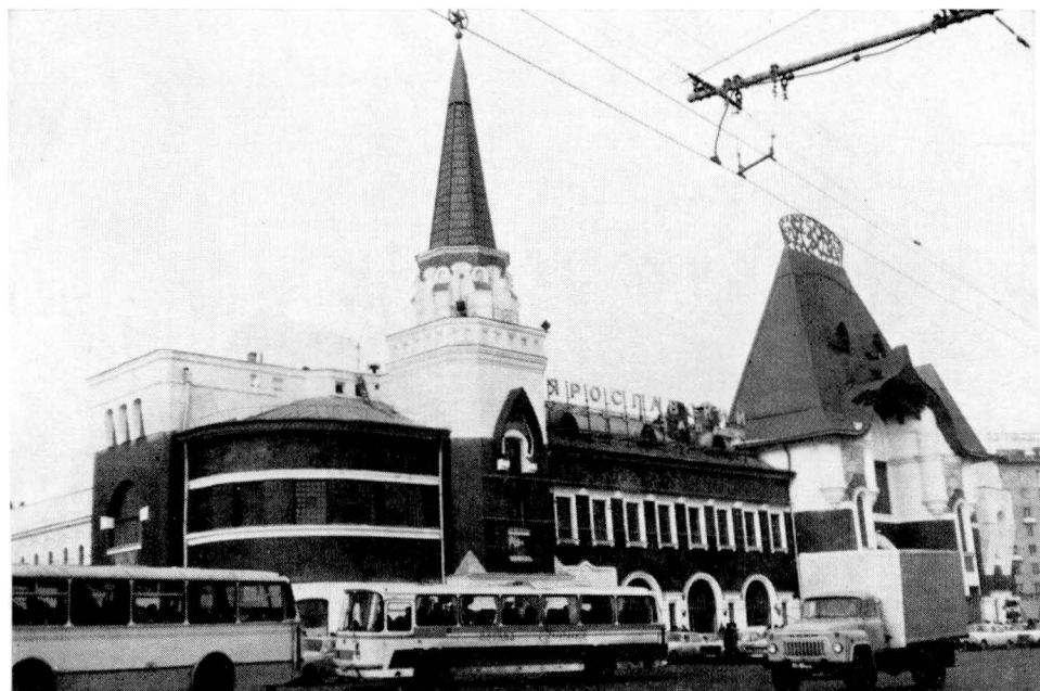
F. O. Šechtěl, Jaroslavské nádraží v Moskvě, 1903—1904. Celkový pohled. Srov. kap. VI. a VII.