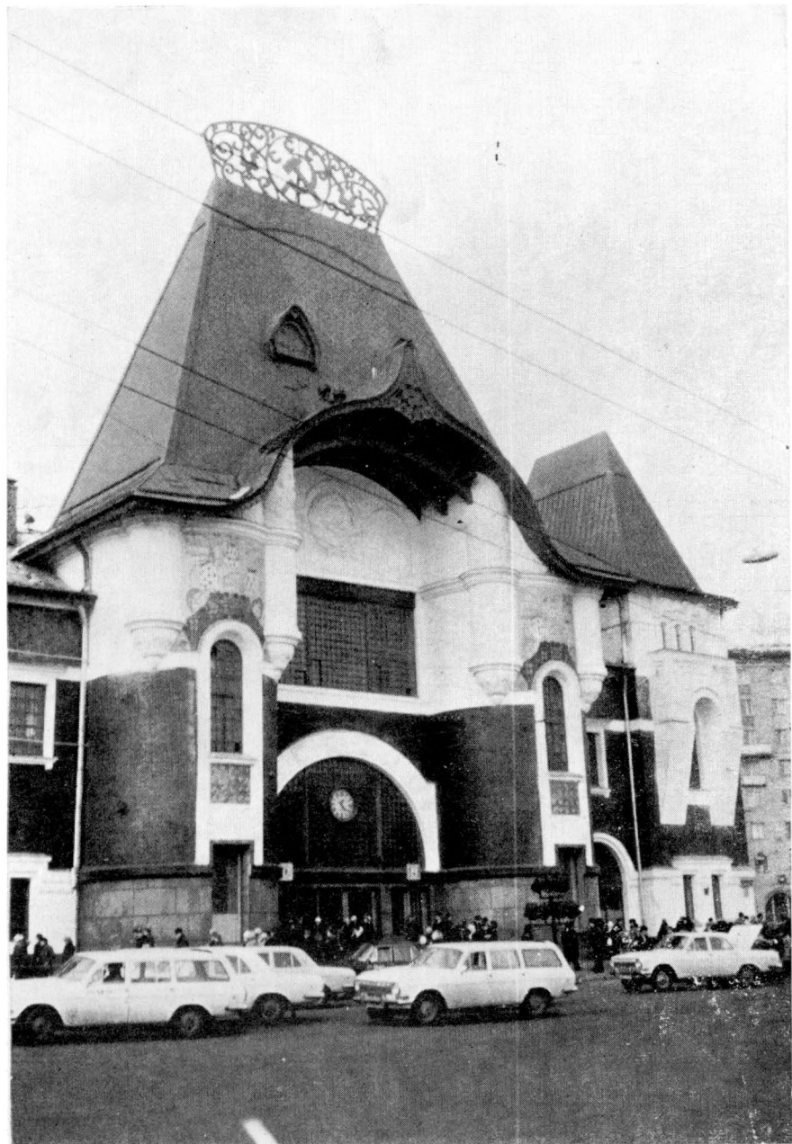
F. O. Šechtěl, Jaroslavské nádraží v Moskvě, 1903—1904. Hlavní vchod. Srov. kap. VI. a VII.