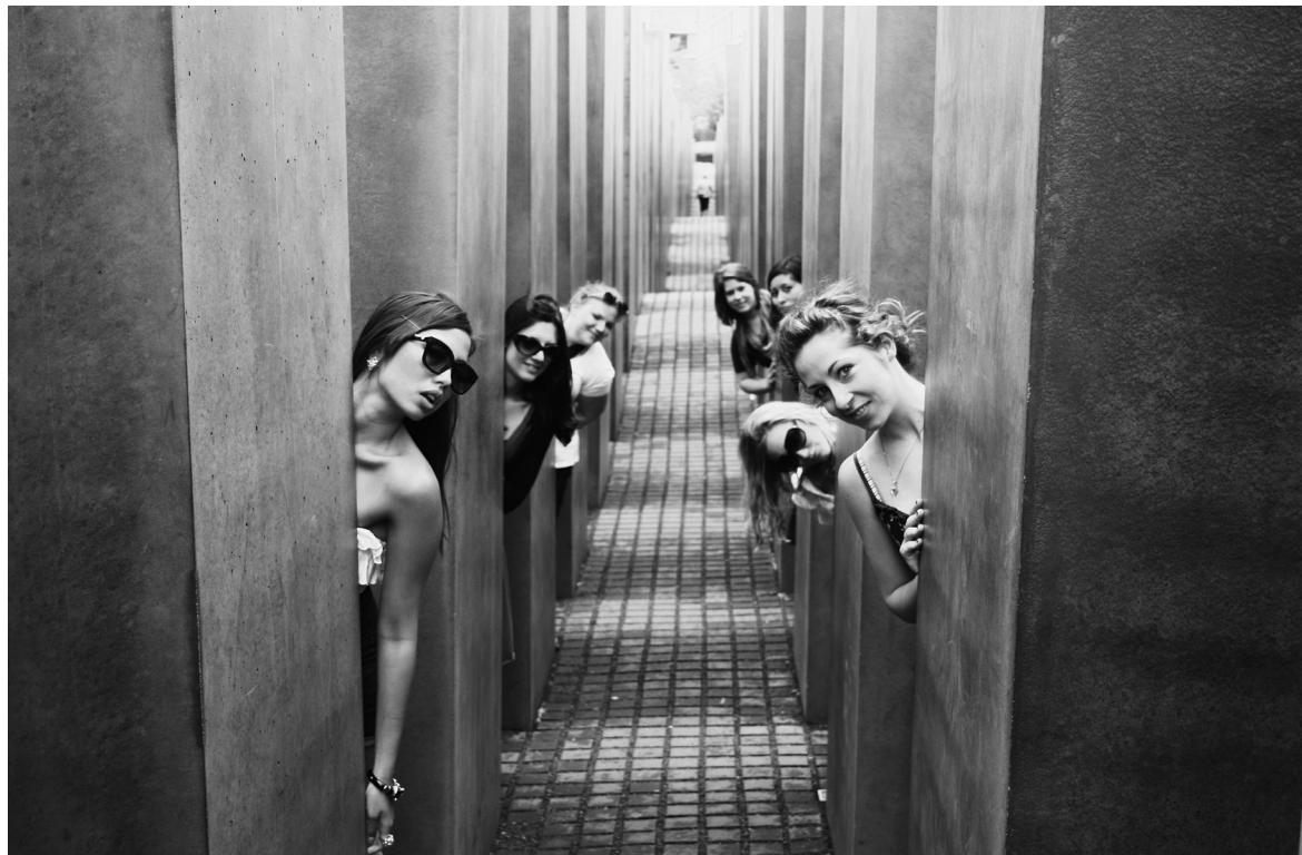
Památník obětem Holocaustu, Berlín.

bude vnímat stěnu k malování, někdo plochu k ležení, kdosi jiný prostor ke hře „na babu“, jiný k truchlení či vzpomínání.