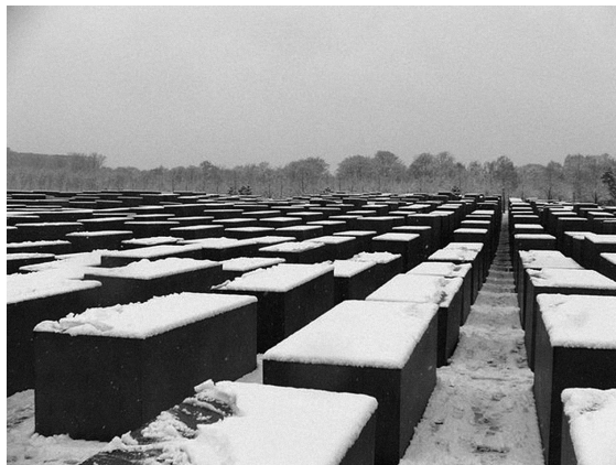
Památník obětem Holocaustu, Berlín.

Domovským teritoriem pojmu intence jsou však samozřejmě především disciplíny zabývající se výkladem lidské myslí a jejího fungování – tedy filozofie myslí a v posledních letech též kognitivní vědy a neurovědy. Ač by se mohlo zdát, že umělecko-historické a filozofické (zejména fenomenologické) pojetí intence, v linii od Brentana a Hus-