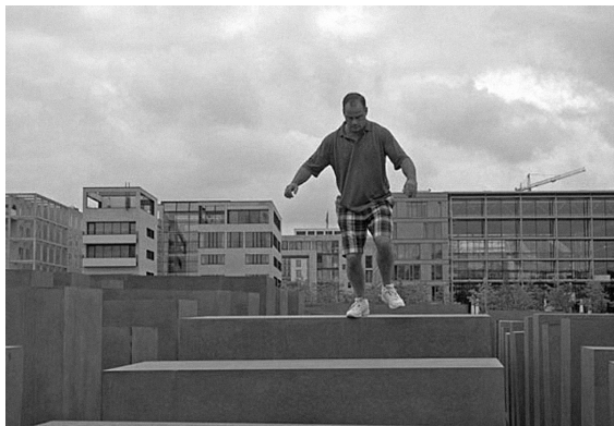
Památník obětem Holocaustu, Berlín.

všechny budoucí generace, aby nikdy více nezneužívaly lidská práva, bránit demokratický ústavní stát po všechny časy, zajišťovat rovnost před zákonem pro všechny lidi a vzdorovat všem formám diktatury a režimů založených na násilí“. 26