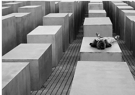
Památník obětem Holocaustu, Berlín.

Jakým způsobem však může monument, vizuální objekt, naplňovat takovou intenci: truchlit, připomínat, symbolizovat, či dokonce bránit a varovat? Obecně vzato třemi způsoby: svým umístěním (podstatná část debat v úvodní fázi projektu se týkala právě lokality a jejích symbolických asociací), svými rozměry a především a zejména svojí morfologií a prostorovou konfigurací, jež umožňuje dané způsoby vnímání a užívání. Žádný materiální objekt a rituální prostor však evidentně není schopen reprezentovat a symbolizovat, tím méně truchlit či připomínat, sám o sobě. Deklarovanou intenci lze naplnit jedině prostřednictvím individuálních prožitků a zkušeností návštěvníků, v interakcích konkrétních lidských subjektů s tímto dílem. Správná otázka tedy zní, jakým způsobem památník aktivuje a udržuje akty truchlení, komemorace či reflexe svých návštěvníků. Diskuse a kontroverze, které provázely nejen budování berlínského památníku, ale také další veřejné komemoratívni projekty posledních desetiletí, potvrzují, že neexistuje žádný defaultní způsob truchlení či připomínání, že obecná intence, aby monument připomínal a repre-