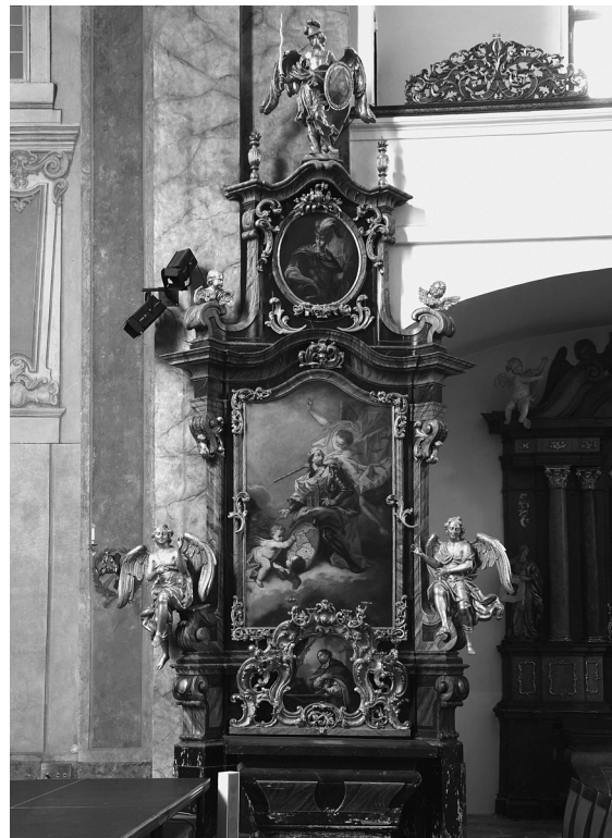
Obr. 7: Josef Redelmayer, Sv. Leopold, boční oltář, kostel sv. Šimona a Judy, Praha-Staré Město, kolem 1773.

Barbara und Xaveri[us] Raab. 12 Crucifix fresko v[on]. jungen Steinfels, 13 in andern Kappellen v[on]. Wodniansky 14 Liborius v[on]. Raab, 15 an der Thür Vitus und Wenzeslaus v[on]. Wodniansky auch in Kupfergestochen 16 die Kirche nach der Römischen Ordnung lesen marmorirt wie auch alle Altäre bis Crucifix und 3faltigkeit, noch aus dem vergangen Jahrhundert. 17