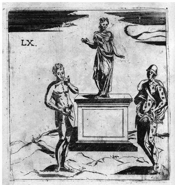
Obr. 2. Vincenzo Cartari, Harpokratés, Sigalion a Angerona, Immagini degli dei , 1683.