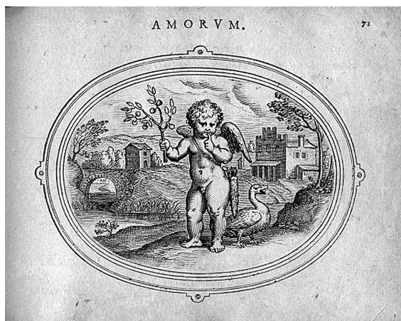
Obr. 3. Otto van Veen, Amorum emblemata, emblém Nocet esse locutum , 1608.

Raně novověká ikonografie pak obohatila tuto základní vizuální linii božstev mlčenlivosti o novou symboliku, která se přizpůsobovala rozšiřujícímu se významovému kontextu jejich využití. Samotná Ripova Iconologie v opisech zobrazení mlčenlivosti přidávala navíc symbol husy s kamenem v zobáku