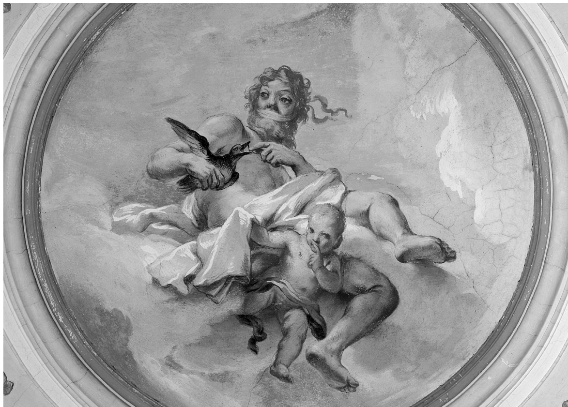
Obr. 5. Andrea Lanzani, Alegorie mlčení (Harpokratés) , zámek Slavkov u Brna, 1702–1703.