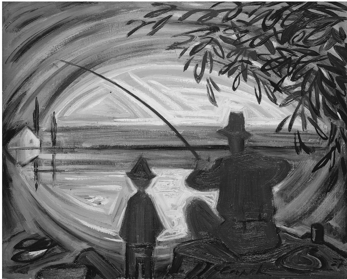
Obr. 2. Josef Čapek, Rybář s chlapcem , skica, 1937, olej, plátno, 45 x 55,5 cm, vpravo dole: „Čapek 37“, soukromá sbírka.

U Čapka se motiv odrazu na vodní hladině objevuje v dřívějších dílech U vody (asi 1916–1917) a Štvanice (asi 1918–1919). První obraz je krajina skládaná z geometrických tvarů, kde se v úzkém pásu zcela dole zrcadlí fragment scény shora, zřetelné linie prvotního obrazu se znejasňují, pevný tvar se rozmazává. Odraz je pojat jako protiklad dvou malířských způsobů zachycení tvarů – v horní části jejich jasného a jednoznačného vymezení a dole chvějivé nejednoznačnosti. 21 Podobné provedení s odlišením obrazu a odrazu nalezneme též v malbě kolem roku 1900, například u zmiňovaného Antonína Slavíčka.