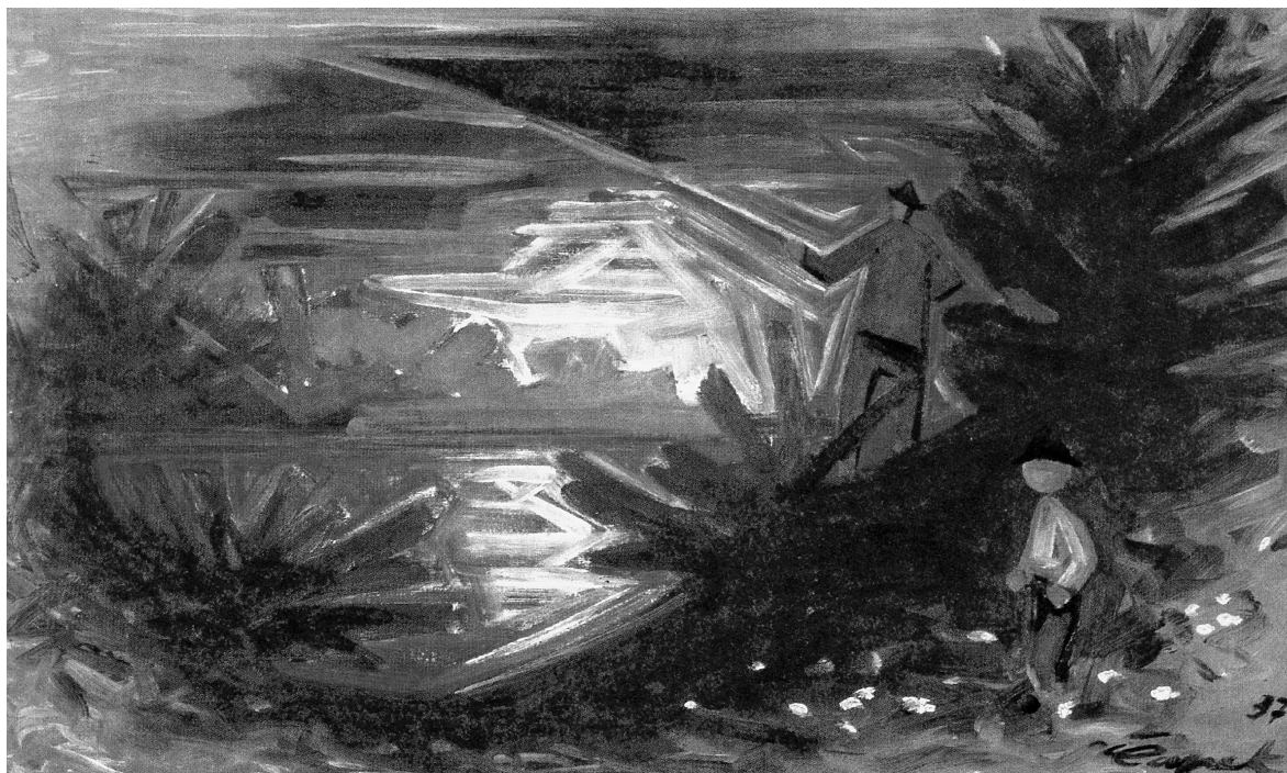
Obr. 5: Josef Čapek, Rybář k podvečeru , 1937, olej, plátno, 46,5 x 75,5 cm, vpravo dole: „37. Čapek“, soukromá sbírka. Repro: Jaroslav Slavík – Jiří Opelík, Josef Čapek , Praha 1996, s. 449.

Rozpojení tvarů je otevřením, v něm se ukazuje v dálce na obzoru a ve středu mezi postavami bílé stavení, které symbolizuje domov, návrat, bezpečí. Otevřená brána světa míří k domovu, k počátku.