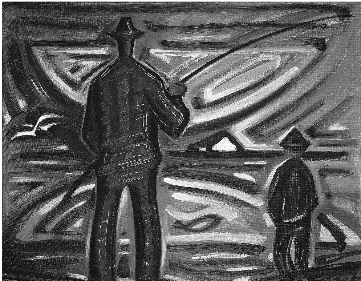
Obr. 1: Josef Čapek, Stojící rybář , 1937, olej, plátno, 48 x 60 cm, vpravo dole: „37. Čapek“, soukromá sbírka.

ké postavy: kulhavého poutníka v eseji, v malbě pak rozjímající figury, kterou nejlépe zastupuje právě rybář nad vodami. Obě postavy, literární i výtvarná, podporují reflexivní charakter Čapkovy tvorby té doby a potvrzují stálou provázanost jeho psaní a malování, jak je známe z předchozí doby. Autostylizační metafora rybáře je ostatně užita i v Kulhavém poutníku jako výmluvný výraz autorovy skepse či pocitu marnosti z vlastní práce na jmenovaném textu i z tvorby vůbec: „ Je mi už souzeno, abych s prázdným prutem seděl nad hladinami a nepřinesl domů té nejzácnější kořisti. “ 6