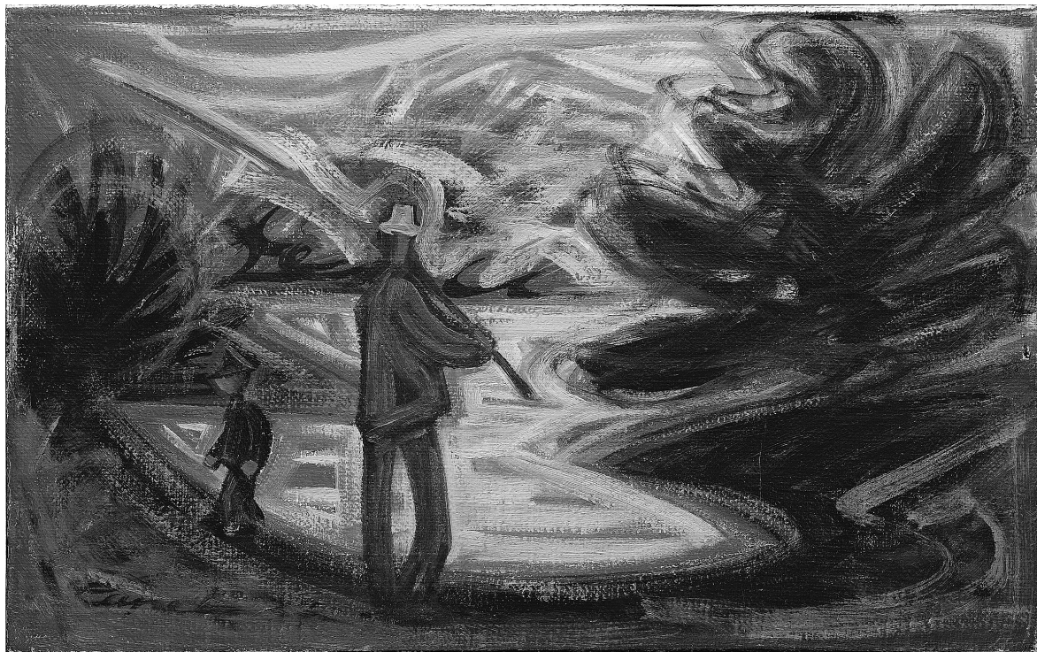
Obr. 3: Josef Čapek, Před západem slunce , skica, asi 1937, olej, juta, 45 x 75 cm, vlevo dole: „Čapek“, soukromá sbírka. Foto: Ota Palán.

odráží tvar, zezdola nahoru barva. Druhotné postavení odrazu se zde pomocí výtvarných prostředků vyrovnává.