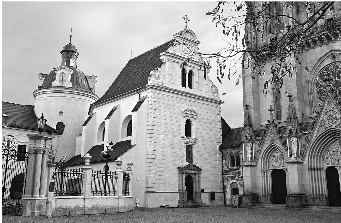
Obr. 9: Olomouc, kaple sv. Anny, 1617 (úpravy 1885–1886), pohled od jihozápadu.

ní. „Moderní“ ostentativní charakter těchto efektních manýristických staveb je tak možné vnímat jako demonstrativní politikum a výraz úsilí po etablování a zviditelnění se ve stavovských strukturách.