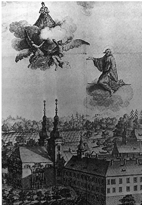
Obr. 13: Vranov u Brna, paulánský konvent s kostelem Panny Marie, před 1630, rytina, 18. století. Foto: Jiří Kroupa, Kunst, Mäzenatentum und Gesellschaft in Mähren 1620–1650 , in: Klaus Bussmann – Heinz Schilling (eds.), 1648. Krieg und Frieden in Europa I. (kat. výst.) , Westfälische Landesmuseum Münster – Kunsthalle Dominikanerkirche Osnabrück, München 1998.

Bylo by snad možné jmenovat i další příklady protobarokního architektonického stylu, uváděného na Moravu v první třetině 17. století, pro zamýšlený účel ale tento „vzorek“ stačí. Představené stavby snad dobře ilustrují nový styl, někdy ještě do jisté míry „přechodový“, který za spoluúčasti manýristického formálního aparátu postuluje motivy protobarokní estetiky. Formální rysy monumentalit a přísné působivosti, jednoduchosti a pádnosti této „manifestační architektury“ přitom konvenují s jejím ideovým obsahem. V případě sakrální architektury reflektuje některé zásady potridentské architektonické teorie a především demonstuje sílicí postavení, či přinejmenším pretence, zdejší církevní hierarchie a jejích aristokratických partnerů. Není patrně náhodou, že tyto stavby souvisejí s katolickým objednavatelským prostředím, které jimi vyjadřovalo novou sebe-