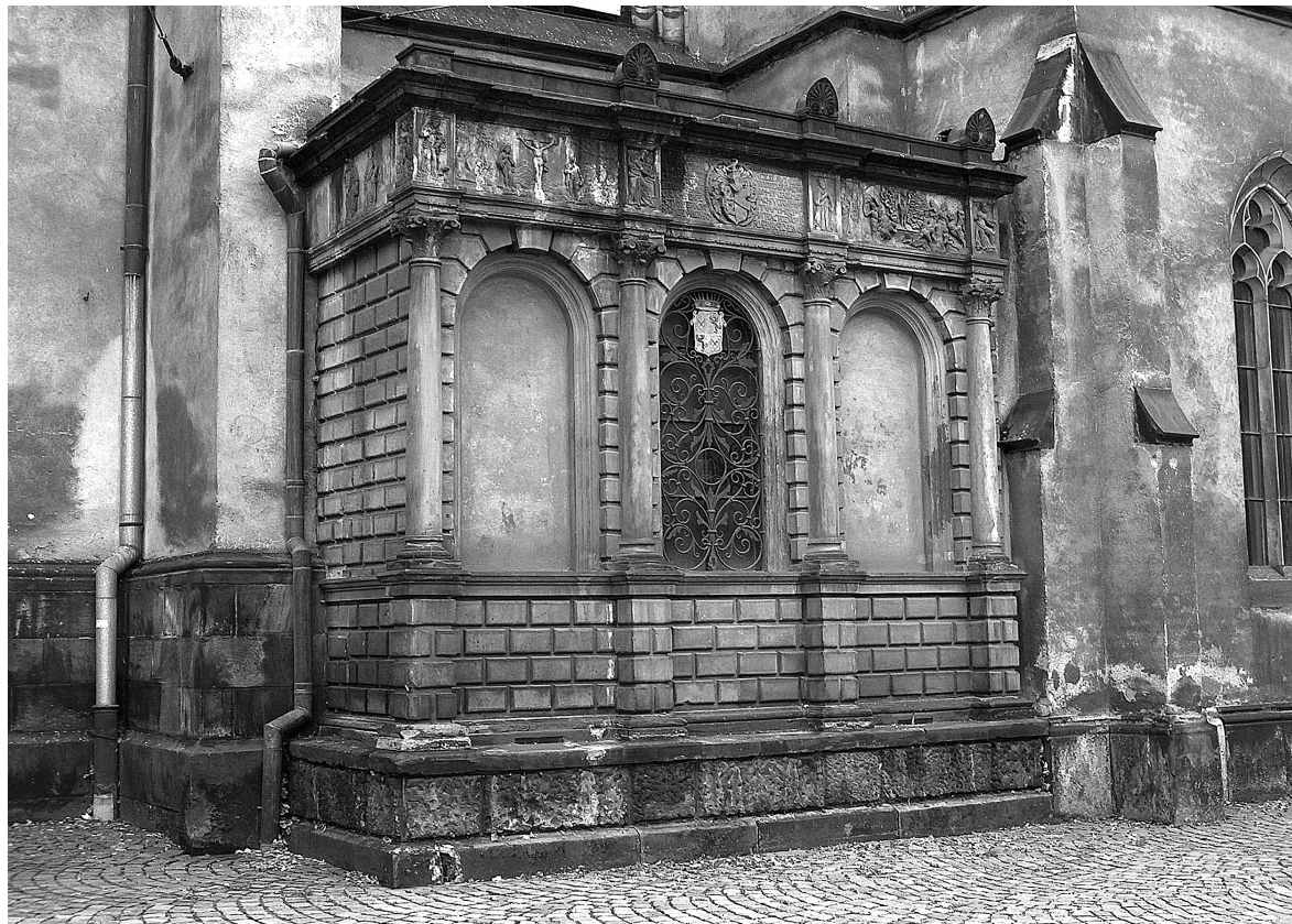
Obr. 7: Olomouc, hrobní kaple Edelmannů z Brosdorfu při farním kostele sv. Mořice, 1572, pohled od severovýchodu.