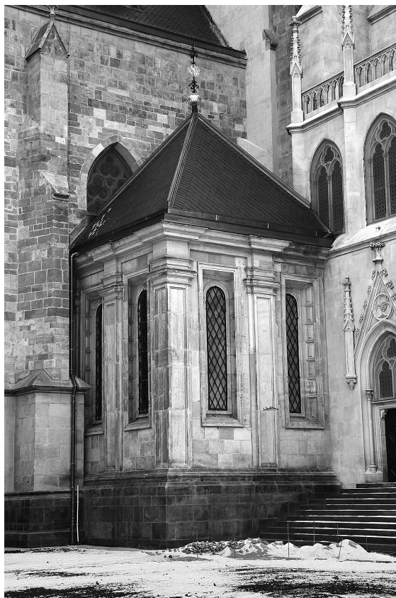
Obr. 6: Olomouc, kaple sv. Stanislava při katedrále sv. Václava, 1585–1591, pohled od jihozápadu.

Kaple tedy byla svým způsobem i devocionálně-memoriální stavbou zasvěcenou sv. Stanislavovi a v tomto ohledu nepřekvapí, že byla patrně již v průběhu stavby zbavena své sepulkrální funkce ve prospěch čistě liturgické, v čemž biskup Pavlovský nejspíše věrně následoval potridentské instrukce, zejména Karla Boromejského. Její distinktivní a nezvyklá manýristická forma je svým způsobem analogická neméně bezprecedentnímu vystupování hlavy moravského kléru, biskupa, který získal pro olomoucké biskupy potvrzení knížecího titulu, byl agilním reprezentantem císařské politiky na Moravě a stoupencem striktního konfesionalizačního (potridentského) programu. Kaple a zejména její výzdoba nesla řadu aktuálních odkazů, souvisejících s upevňováním pozice olomouckých biskupů – potvrzení knížecího titulu, vítězství nad zemským soudem ve věci sporu o jurisdikci nad klérem. Tento program byl do jisté míry historizující, zvláště s ohledem na aktualizaci legendy sv. Stanislava, který reprezentoval obdobný spor světské (zde i protestantské) moci s mocí duchovní, její manifestační a konfrontační charakter byl ovšem plně vyjadřován moderní okázalou formou manýristické, efektní architektury. Výjimečnosti stavby přitom plně odpovídá zvažovaná osobnost projektanta – rudolfinského architekta, Florentána Giovanniho Gargiolliho. 27 Kaple sv. Stanislava, ovšem i související přestavba katedrálního průčelí do triumfální trojvěžové podoby, působila jako okázalé