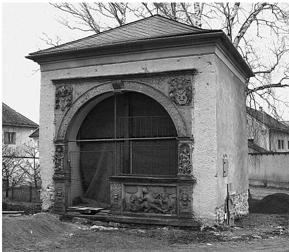
Obr. 8: Postřelmov, hrobka Bukůvků z Bukůvky, 1592, celkový pohled.

lem statku Chromeč, bratrem zmiňovaného Jana, disponujícího v rámci rozdělení rodových statků nepoměrně menším majetkem. Stavba dokončená roku 1592 stojí v těsném sousedství farního kostela a natáčí se svým průčelím k jeho hlavnímu vstupu. Vzhledem k tomu, že Chromeč spadala pod farní obvod postřelmovského kostela, musel Zikmund získat pro stavbu kaple, nazývané dle dobového pramene jednoduše „pohřeb“, souhlas majitele tohoto statku a patrona kostela v Postřelmově, kterým byl Ladislav Velen ze Žerotína, respektive jeho poručníci. Přes poměrně jednoduchou dispozici a rustikální sochařskou výzdobu průčelí představuje tato stavba jedinou volně stojící renesanční centrálu pohřební kaple. Hrobní stavbu tvoří kubus o ne zcela pravidelné čtvercové základně, zaklenutý kupolovitou klenbou se štukovými rámci, opatřený suterénní hrobní komorou. Funkce čtvercového prostoru nad ní není zcela jasná, ale lze předpokládat, že se jednalo o liturgický prostor s oltářem, ke kterému byl určen plat 15 zl. záduší. 30 O uspořádání a výzdobě interiéru si tedy nemůžeme udělat představu, nicméně o „výpravnosti“ fundace svědčí zachované průčelí s bohatou reliéfní výzdo-