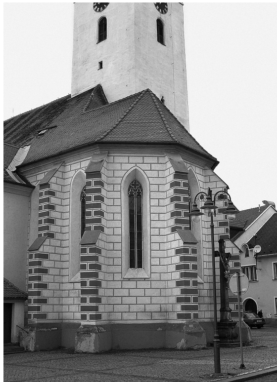
Obr. 5: Jemnice, kostel sv. Stanislava 1580–1590, pohled na presbytář od jihovýchodu.

vou litou mříží vstupu s bohatým dekorativním a zejména ideovým programem. Kaple zahrnovala i bohatou a programově koncipovanou výzdobu. Již v roce 1588 je doložena objednávka oltáře a komplexně byla kaple vyzdobena roku 1591. Sochařská (štuková) výzdoba stěn Giorgia Gialdiho zahrnovala erbovní vývod biskupa Pavlovského z Pavlovic na čtyři předky, andílky, christologický emblém pelikána, zobrazení ctností Lásky, Víry a Naděje a sochy sv. Václava a Stanislava. Malíř Gerhard von Falkenburg měl ve stejném roce pokrýt kapli nástěnnými malbami, obsahujícími opět biskupův znak, ale také Arma Christi a vedle dalšího dekorativního aparátu zejména scény ze života patrona biskupa i kaple – sv. Stanislava. Exkluzivní charakter stavby ocenil na jaře 1597 i papežský ceremoniář Giovanni Paolo Mucante, kte-