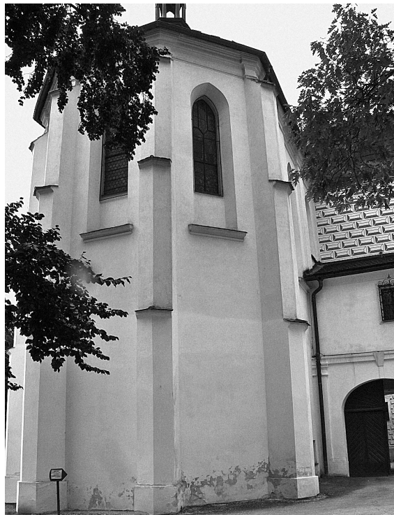
Obr. 3: Březnice, zámecká kaple, před 1632, pohled od severovýchodu.