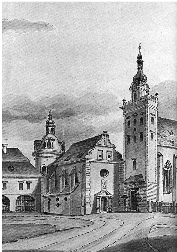
Obr. 10: Olomouc, kaple sv. Anny při katedrále sv. Václava, Franz Biela, 1854, akvarel, detail.

ně i v původní nezkrácené stavbě muselo být toto vyvážení longitudinální a centrální dispozice patrné. Také lunety prostor uzavírají, ale neoddělují a spíše plynule propojují sféry zdi a klenby, stejně jako volně plyne valená klena s lunetami, jejichž „křížová pole“ nejsou nijak oddělena. Světelná inscenace v interiéru kaple musela být oproti dnešnímu stavu kvalitativně značně odlišná, nejen pro otevření termálními okny i na východní straně, ale i pro velké jižní kruhové okno, které před oltář přinášelo intenzivní osvětlení. Rovněž fasáda kaple byla pozoruhodně řešená. Vůbec celý objem stavby se uplatňoval více než dnes, a to nejen pro zkrácení stavby, ale též kvůli jejímu otevření i na východní stranu, tam, kde dnes ústí svými termálními okny do podkrovního ambitu