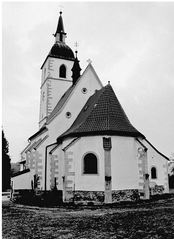
Obr. 4: Stará Ves nad Ondřejnicí, kostel sv. Jana Křtitele, 1591.

je vyzdoben nepoměrně rustikálnějšími reliéfy, zahrnujícími vedle ústřední heraldicko-nápisové scény Ukřižování a Zmrtvýchvstání Krista s doplňujícími postavami sv. Petra a Pavla, sv. Šebestiána a evangelisty sv. Lukáše, Matouše a Marka. Koncepce výzdoby je relativně blízká výzdobě portálu drážďanské zámecké kaple (1556), 25 ovšem její přesný program není přes základní náboženský (sepulkrálně-eschatologický) rozměr příliš jasný. Exkluzivita této stavby je přes spornou úroveň sochařské výzdoby, viděno dnešními očima, nepochybná. Plně odpovídá záze- mí objednavatele, prestižního katolíka, který se pohyboval v nejvyšších patrech lokální hierarchie a jenž svým ostentativním postojem, politickými postoji a partnerstvím s olomouckými biskupy přinejmenším iritoval významnou část olomoucké nekatolické komuni-