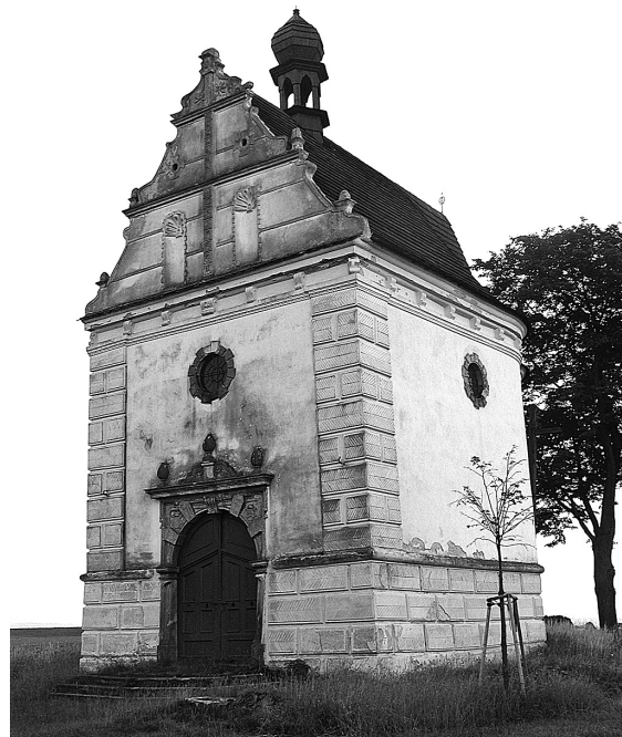
Obr. 12: Úsov, kaple sv. Rocha, 1624, pohled od jihozápadu.

S tímto objednavatelským prostředím souvisí i další exemplární protobarokní stavba – poutní kostel Panny Marie ve Vranově u Brna, postavený Maxmiliánem z Liechtensteina, bratrem fundátora úsovské kaple, jenž patřil po své konverzi údajně k nábožensky nejhorlivějším členům rodu. Již v roce 1617 se Andrea Erna zavázal provést plány „Joana Marii“, nejspíše Giovanniho Marii Filippiho, kostel byl ale postaven až před rokem 1630. 45 Jednoduchý, pádný a monumentální objem stavby i její homogenní prostor dobře ztělesňují architektonický purismus nastupující protobarokní estetiky. Výmluvně přitom je, že