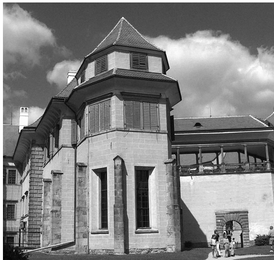
Obr. 1: Telč, zámecká kaple Věch svatých, pohled od jihovýchodu, 1575–1580.

a „exemplární“ objekty typu pražského Valdštejnského či brněnského Dietrichstejnského paláce, ale naopak o mnohem nenápadnější stavby. Na jejich vypovídací hodnotě a „exemplárnosti“ to ale vůbec neubírá.