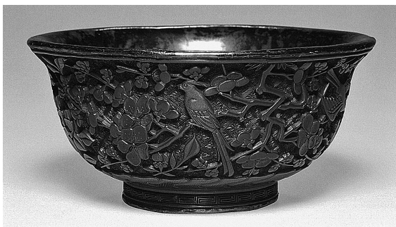
Obr. 11: Miska s dekorem s motivy květin a ptáků, dřevo s červeným vyřezávaným lakováním (dynastie Ming, asi první polovina 16. století). Repró: Monika Kopplin (ed.), Im Zeichen des Drachen. Von der Schönheit chinesischer Lacke. Hommage an Fritz Löw-Beer , München – Münster – Stuttgart 2006, s. 150 (č. kat. 66).