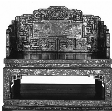
Obr. 10: Císařský, tzv. „dračí“ trůn, černě lakované palisandrové dřevo vykládané zlatem a perletí (dynastie Qing, poslední třetina 17. století). Repró: Monika Kopplin (ed.), Im Zeichen des Drachen. Von der Schönheit chinesischer Lacke. Hommage an Fritz Löw-Beer , München – Münster – Stuttgart 2006, s. 204 (č. kat. 101).