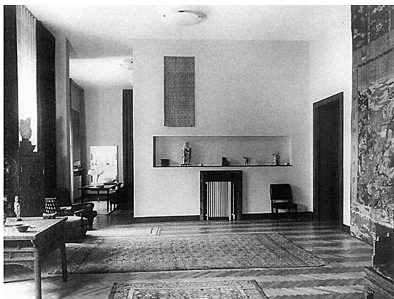
Obr. 7: Rudolf Baumfeld, interiér bytu Fritze Löw-Beera v patře tzv. Velké vily ve Svitávce, polovina třicátých let 20. století; vlevo červeně lakovaný vyřezávaný stůl (dynastie Ming, rané 15. století), vpravo část tzv. „dračího trůnu“ (dynastie Qing, poslední třetina 17. století).

Repro: Matthias Boeckl (ed.), Visionäre und Vertriebene. Österreichische Spuren in der modernen amerikanischen Architektur ; Berlin 1995, s. 260.