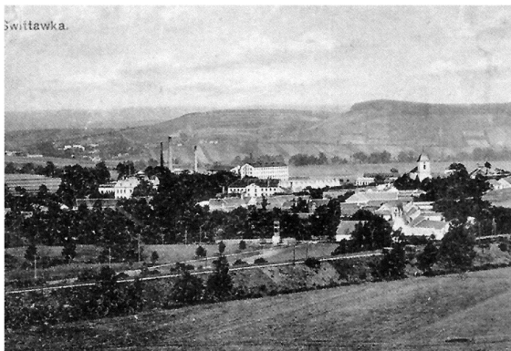
Obr. 1: Svitávka ve dvacátých letech 20. století, v pozadí objekty firmy Löw-Beer.