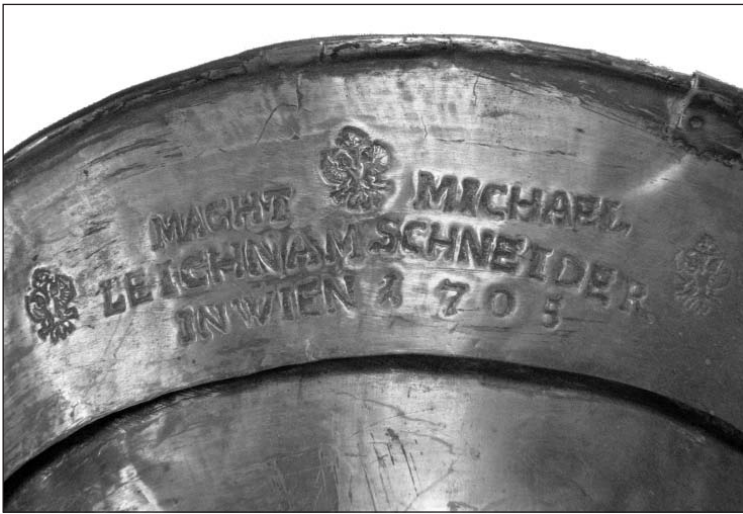
Ab. 2 (Parforcehorn Sign. 77.162)

Ein weiteres interessantes Blasinstrument in den Sammlungen des Museums ist ein Parforcehorn Sign. 77.162 (Ab. 2) aus dem Jahr 1705 aus der Werkstatt des Wiener Instrumentenbauers Michael Leichamschneider (1676–1748). Nach dem Verzeichnis der erhaltenen Instrumente dieses Herstellers im Langwill's In-